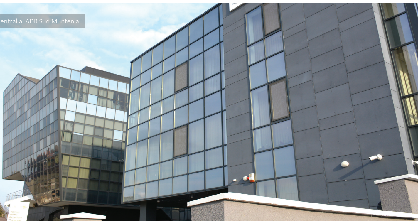
Sediul central al ADR Sud Muntenia

La Mulți Ani cu realizări pe toate planurile!