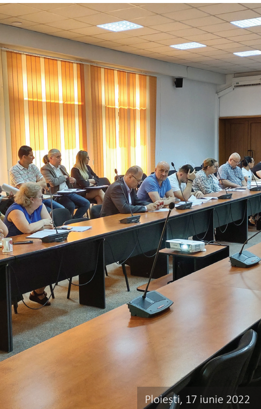
Ploiești, 17 iunie 2022