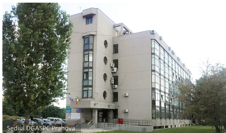
Sediul DGASPC Prahova