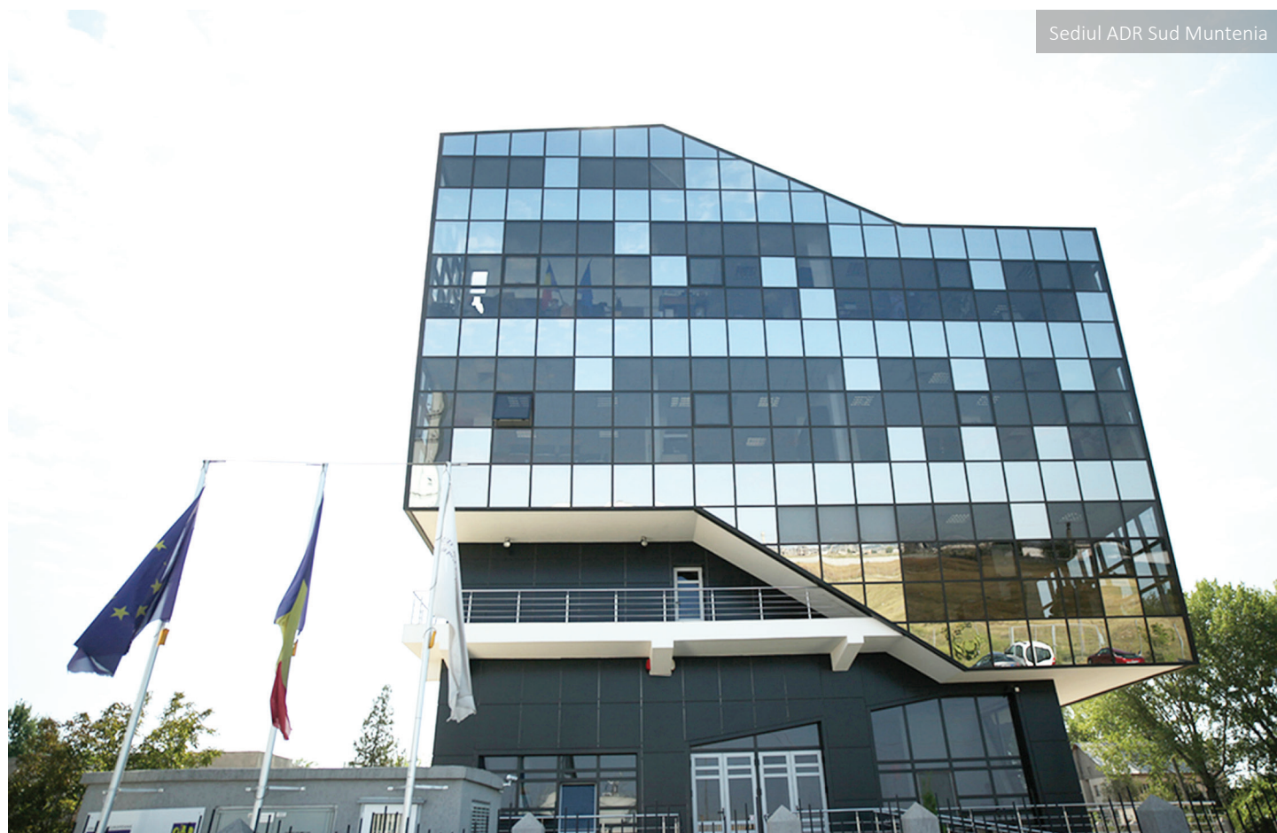
Sediul ADR Sud Muntenia