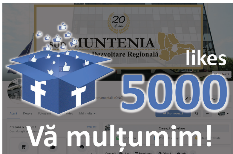
Sediul ADR Sud Muntenia

Astăzi, prezența noastră pe Facebook înregistrează 5.043 aprecieri și 5.234 de urmăritori, având un impact al postărilor de peste 15.000 de vizualizări săptămânal.