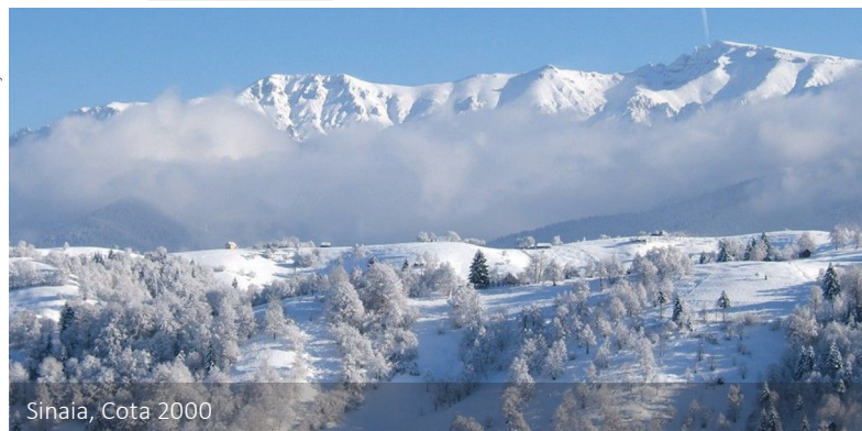
Sinaia, Cota 2000