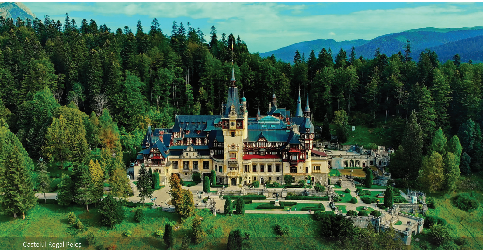
Castelul Regal Peleş