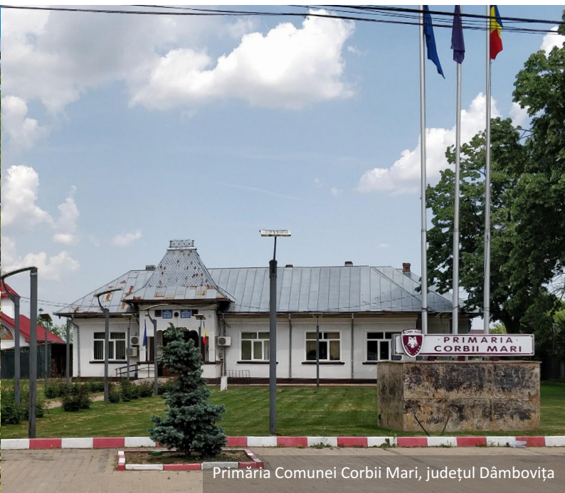
Primăria Comunei Corbiei Mari, județul Dâmbovița