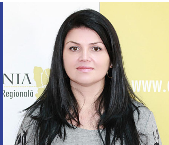
Sediul ADR Sud Muntenia

La Mulți Ani cu realizări în toate domeniile!