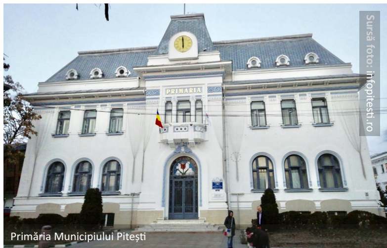
Primăria Municipiului Pitești

Prin intermediul acestui proiect, administrația municipiului Pitești beneficiază de fonduri Regio pentru a îmbunătăți condițiile de viață ale comunității marginalizate din zona delimitată în cadrul aplicației. În acest sens, vor fi realizate lucrări de reabilitare a aleilor pietonale și a trotuarelor, de modernizare a locurilor de joacă și de amenajare a spațiilor verzi. De asemenea, transformarea într-un centru multifuncțional comunitar a corpului C5 din cadrul căminului școlar, în urma unor intervenții de reabilitare și modernizare, va asigura accesul populației deservite la servicii sociale, medicale și educative. Astfel, implementarea acestui proiect va îmbunătăți mediul construit și calitatea serviciilor medicale și sociale, asigurând totodată dezvoltarea comunității și siguranța publică. Prezentul demers este