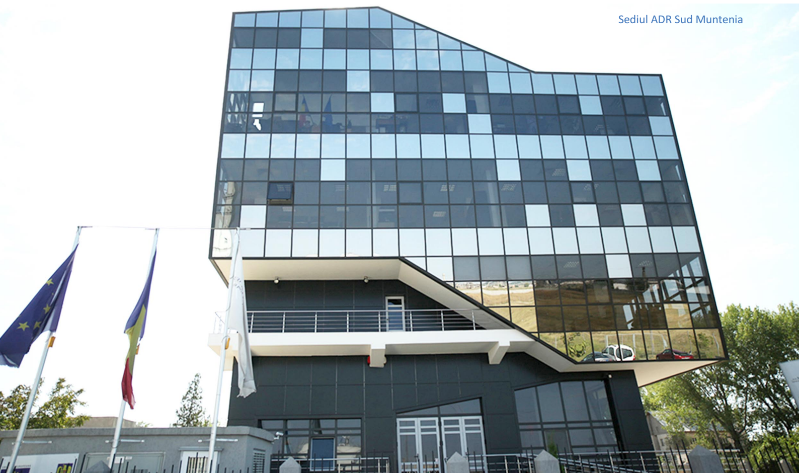
Sediul ADR Sud Muntenia