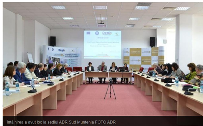
Întâlnirea a avut loc la sediul ADR Sud Muntenia

Agenția pentru Dezvoltare Regională Sud Muntenia a organizat marți, 11 februarie, la sediul central din Călărași întâlnirea regională pe tema dezvoltare rurală și agricultură, ce a avut ca scop actualizarea Planului de dezvoltare regională pentru perioada de programare 2021-2027.