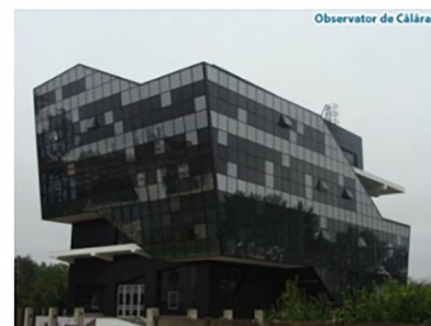
Observator de Călărași

Agenția pentru Dezvoltare Regională Sud Muntenia continuă seria de acțiuni destinate pregătirii perioadei de programare 2021-2027. Astfel,