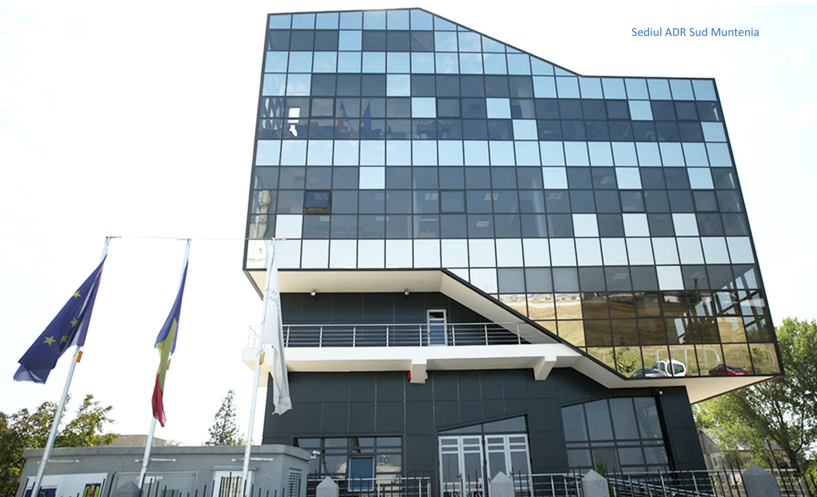
Sediul ADR Sud Muntenia