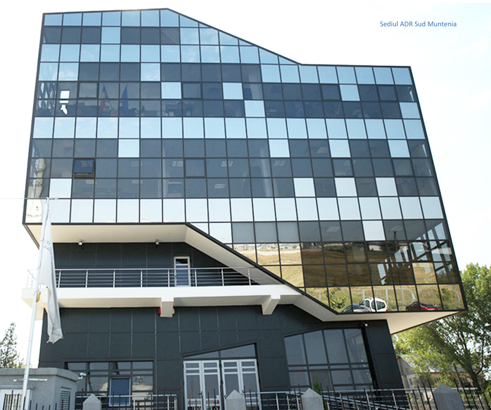
Sediul ADR Sud Muntenia