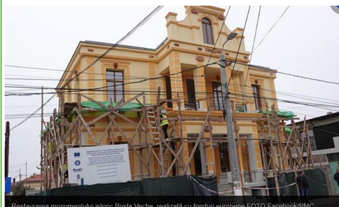
Restaurarea monumentului istoric Poșta Veche, realizată cu fonduri europene

Aboneaza-te la newsletter Adresa ta de email Abonare