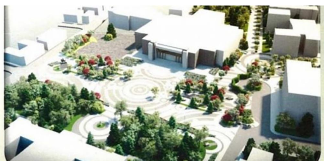
Modernizarea centrului vechi pietonal al Călărașului costă 7,6 milioane de euro, iar investiția va fi susținută din fonduri europene. În peisaj va fi construită Piața Mare după arhitectura tradițional românească.

Aboneaza-te la newsletter Adresa ta de email Abonare