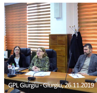
GPL Giurgiu - Giurgiu, 26.11.2019