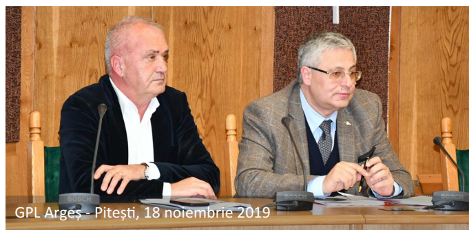
GPL Argeș - Pitești, 18 noiembrie 2019

Evenimentele destinate reuniunii grupurilor de parteneriat local constituie pași importanți spre viitoarea perioadă de programare când, prin implementarea obiectivelor de politică, vom deveni o regiune mai inteligentă, mai ecologică, mai conectată, socială și mai aproape de cetățeni.