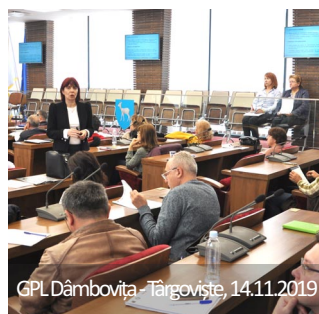
GPL Dâmbovița - Târgoviște, 14.11.2019