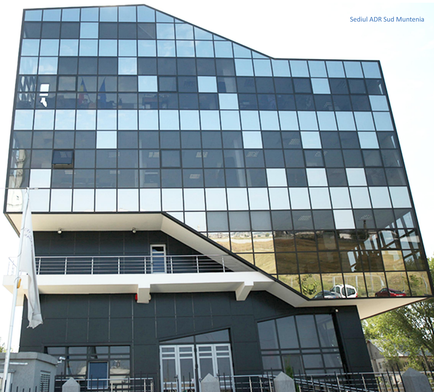
Sediul ADR Sud Muntenia