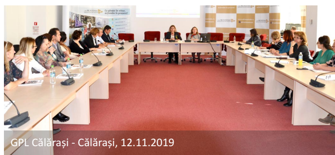
GPL Călărași - Călărași, 12.11.2019