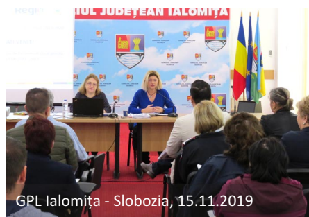
GPL Ialomița - Slobozia, 15.11.2019