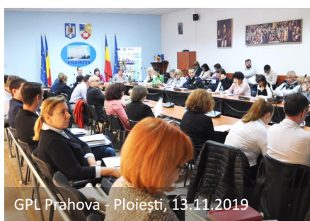
GPL Prahova - Ploiești, 13.11.2019