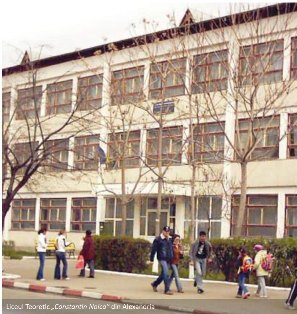
Liceul Teoretic „Constantin Noica” din Alexandria