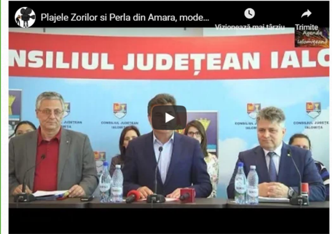
Au fost semnate contractele de finanțare pentru dezvoltarea infrastructurii de turism în stațiunea