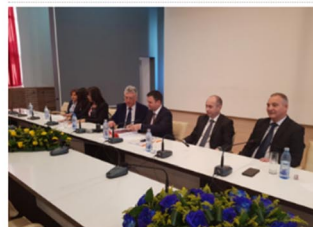
Contractul de finanțare a fost semnat luni la Primărie

Category: Administratie Published: Monday, 08 April 2019 Written by: Interes argesean