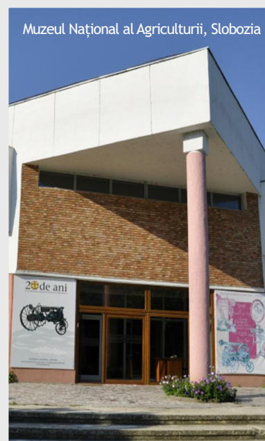
Muzeul Național al Agriculturii, Slobozia