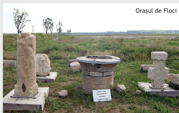
Orașul de Floci