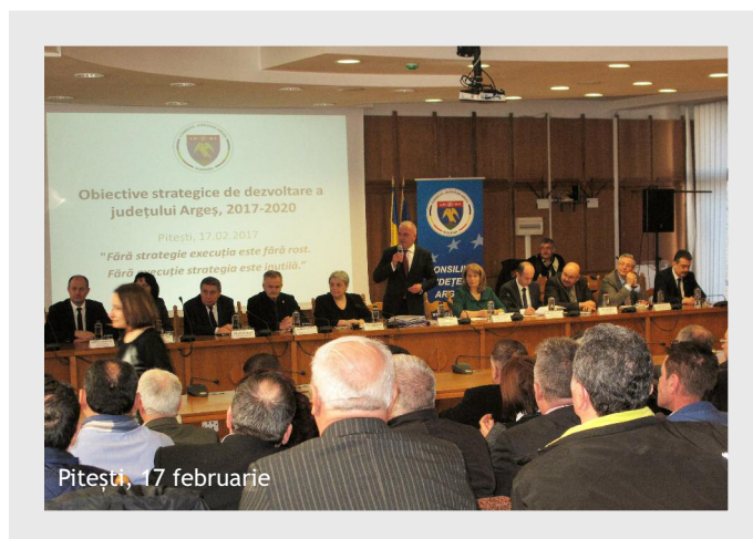
Pitești, 17 februarie

Conform MDRAPFE, referitor la fondurile europene, prioritare sunt măsurile ce vor duce la creșterea absorbției pentru cadrul financiar 2014-2020: lansarea, în acest an, a apelurilor de proiecte pentru toate liniile de finanțare, acreditarea, până la 1 iulie a.c., a tuturor autorităților de management ale