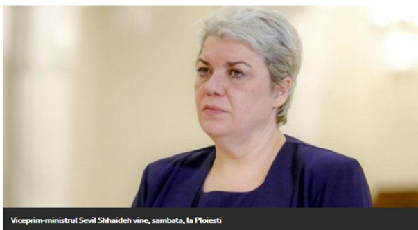
Viceprim-ministrul Sevil Shhaideh vine, sambata, la Ploiesti