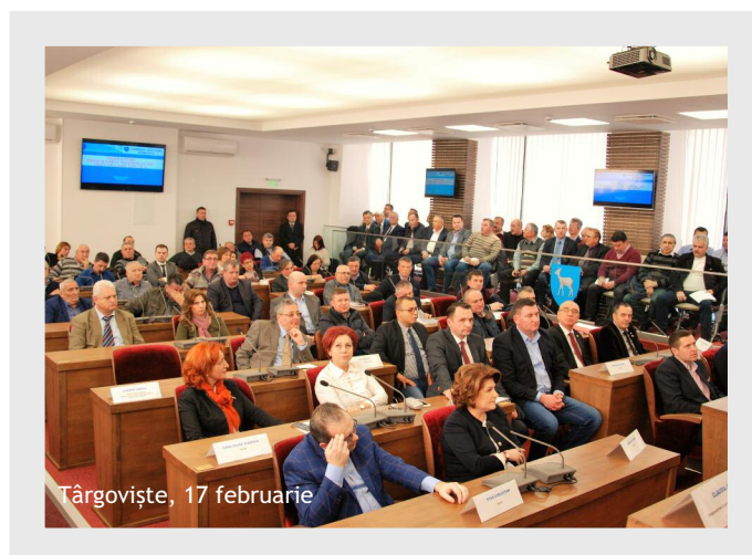
Târgoviște, 17 februarie