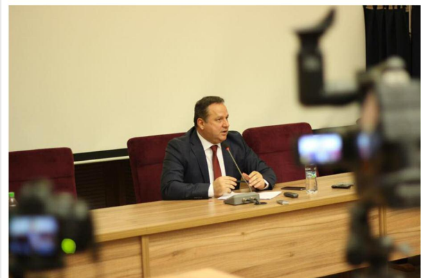
Consilierii Județeni călărășeni au aprobat ieri, 31 ianuarie, solicitarea de transmitere a imobilului „Palatul Administrativ” (clădirea

Consiliul Județean a preluat clădirea Prefecturii