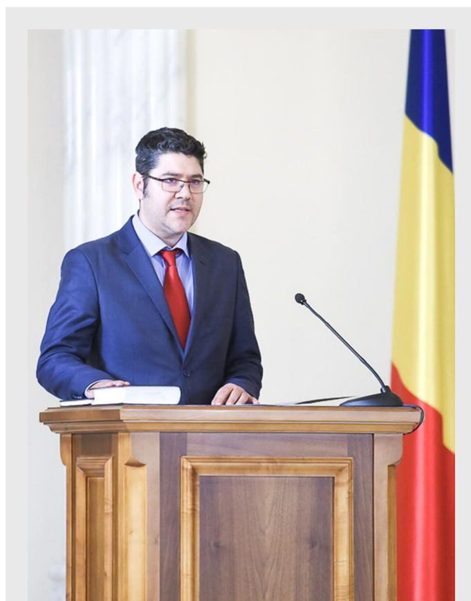
Dragoș-Cristian Dinu, ministrul fondurilor europene

A desfășurat activitate și în zona de planificare strategică și politici publice: asistență pentru reforma administrației publice în Republica Moldova (Chișinău, 2007 - 2008); analiză funcțională a administrației centrale din Kosovo Pristina (Kosovo, 2008 - 2009); CPM Consulting WYG (România, 2009); CPM Consulting Ecorys – Sprijin pentru Strategia