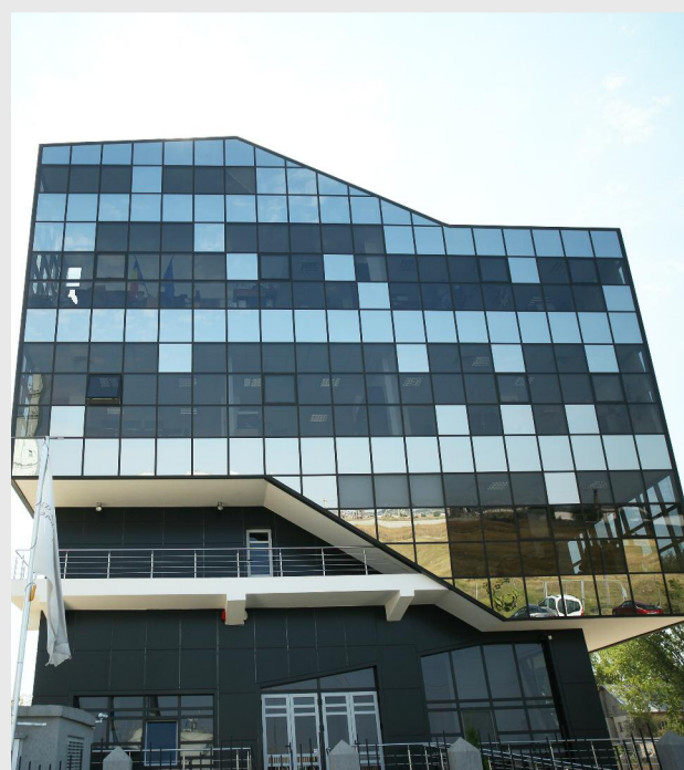
Sediul ADR Sud Muntenia

În noul program nu mai este obligatoriu criteriul „ primul venit, primul servit ”. Totuși, există sesiuni cu termen limită de depunere a proiectelor, în anumite limite bugetare, după care se vor evalua în baza unor grile transparente și vor fi ierarhizate în ordinea punctajului obținut. Astfel, vor fi prioritizate proiectele ce vor fi mai bine realizate din punct de vedere tehnic și cu impact important în comunitățile respective.