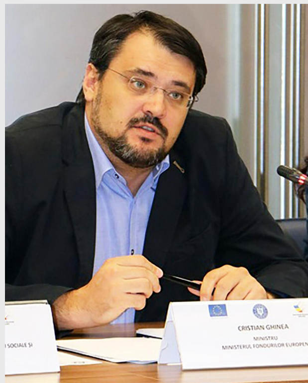
Cristian Ghinea, ministrul fondurilor europene

Fondurile destinate IF în cadrul PO Regional, PO Competitivitate, PO Capital Uman, PO IMM și PNDR vor ajunge, prin intermediarii financiari