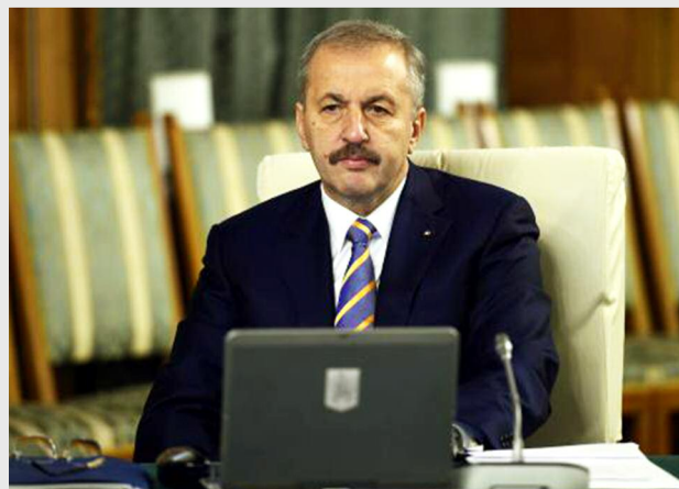
Vasile Dîncu, vicepremierul României

Alte exemple de proiecte aflate în diferite etape și care pot contribui la eficientizarea banilor publici sunt descentralizarea - prin aducerea nivelului de decizie mai aproape de beneficiarul final, simplificarea procedurilor administrative - prin reducerea numărului de documente, formulare și procese utilizate în interacțiunea dintre cetățeni și instituțiile publice și regândirea sistemului de personal din administrație - prin proiectarea unui mecanism care să ducă la o corespondență între nivelul de salarizare și nivelul de performanță al