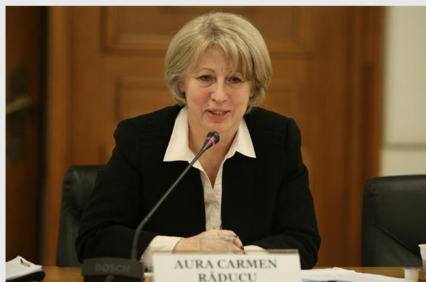
Aura Răducu, ministrul fondurilor europene

Pe Programul Operațional Sectorial „Creșterea Competitivității Economice”, rata de absorbție curentă era de 75,75%, pe Programul Operațional Asistență Tehnică – 80,79%, pe Programul Operațional Sectorial Mediu – 61,99%, pe Programul Operațional Regional – 63,91%, pe Programul Operațional Sectorial Dezvoltarea Resurselor Umane – 54,51%, pe Programul Operațional Sectorial Trans-