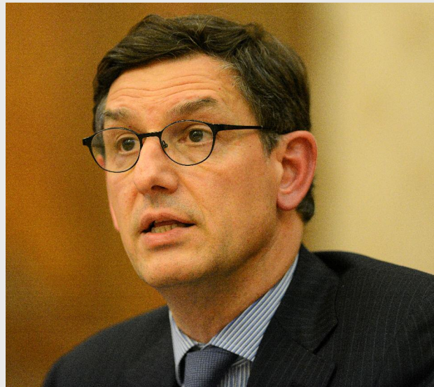
Costin Borc, ministrul economiei

„Avem capitole bugetate pentru programe într-un total de 370 de milioane, dintre care avem un program de stimulare a exporturilor de 45 de milioane, un program național multianual de înființare și dezvoltare de incubatoare tehnologice și de afaceri, de șapte milioane, un program de susținere a meșteșugurilor și artizanatelor de 890.000, o continuare a programului pentru sprijinirea dezvoltării IMM-urilor, de jumătate de milion, trei milioane pentru târgul de IMM-uri, jumătate de milion pentru dezvoltarea culturii antreprenoriale a femeilor manager, 17 milioane pentru tinerii antreprenori, 21 de milioane pentru un program de