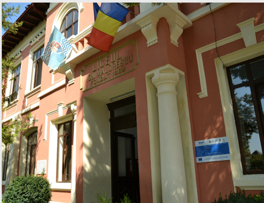
Colegiul „Ion Măiorescu” din Giurgiu

În primul rând trebuie să acceptăm (chiar dacă este extrem de greu la vârsta asta) că suntem foarte influențabili; în consecință, este normal că trebuie să acordăm mare atenție tipului de influență pe care alegem să îl acceptăm. În al doilea rând, este foarte folositor să ne dăm seama cât mai devreme că am ajuns la vârsta la care trebuie să începem să ne construim singuri viitorul. Părinții, în special cei care au crescut în perioada comunistă, încearcă să ne ofere absolut orice, pentru a compensa lipsurile și restricțiile pe care le-au avut în copilărie. Din păcate, o astfel de atitudine a părinților induce deseori iluzia că ne vom putea baza întotdeauna pe ei și că vom fi la nesfârșit sub protecția lor. În realitate, adevărul este altul, și atunci este ideal să devenim responsabili cât mai devreme cu putință.