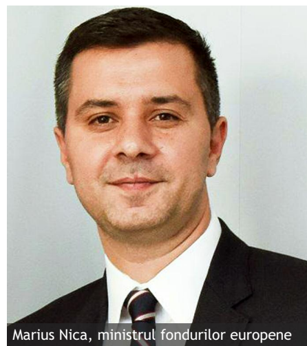
Marius Nica, ministrul fondurilor europene