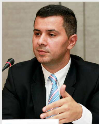
Marius Nica, ministrul fondurilor europene

Ministrul fondurilor europene a arătat că în perioada de programare 2007 - 2013, întreprinderile mari au fost eligibile în Programul Operațional Sectorial „Creșterea Competitivității Economice”, pe Axa prioritară 1 „Un sistem inovativ