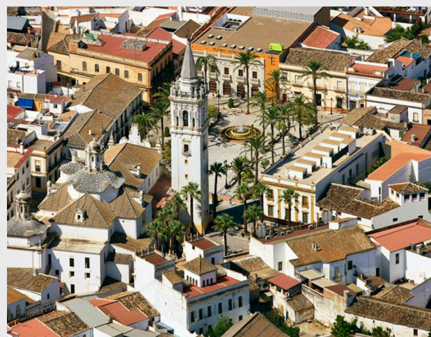
Palma del Condado

• Acțiunea 1: 8 zile pentru activități legate de rețeaua Natura 2000 și turismul bazat pe producția