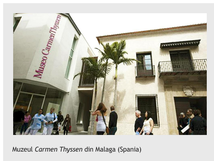
Muzeul Carmen Thyssen din Malaga (Spania)

Un model inovator de dezvoltare strategică