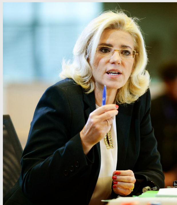
Corina Crețu, comisarul pentru Politică Regională

Conform doamnei comisar pentru Politică Regională, Corina Crețu, prezentă la eveniment, „ce-