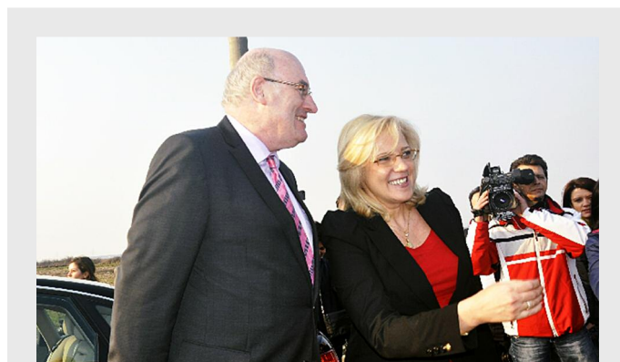
Corina Crețu, comisarul european pentru dezvoltare regională, alături de Phil Hogan, comisarul european pentru agricultură și dezvoltare rurală

Înaltul oficial european a fost însoțit de mi-