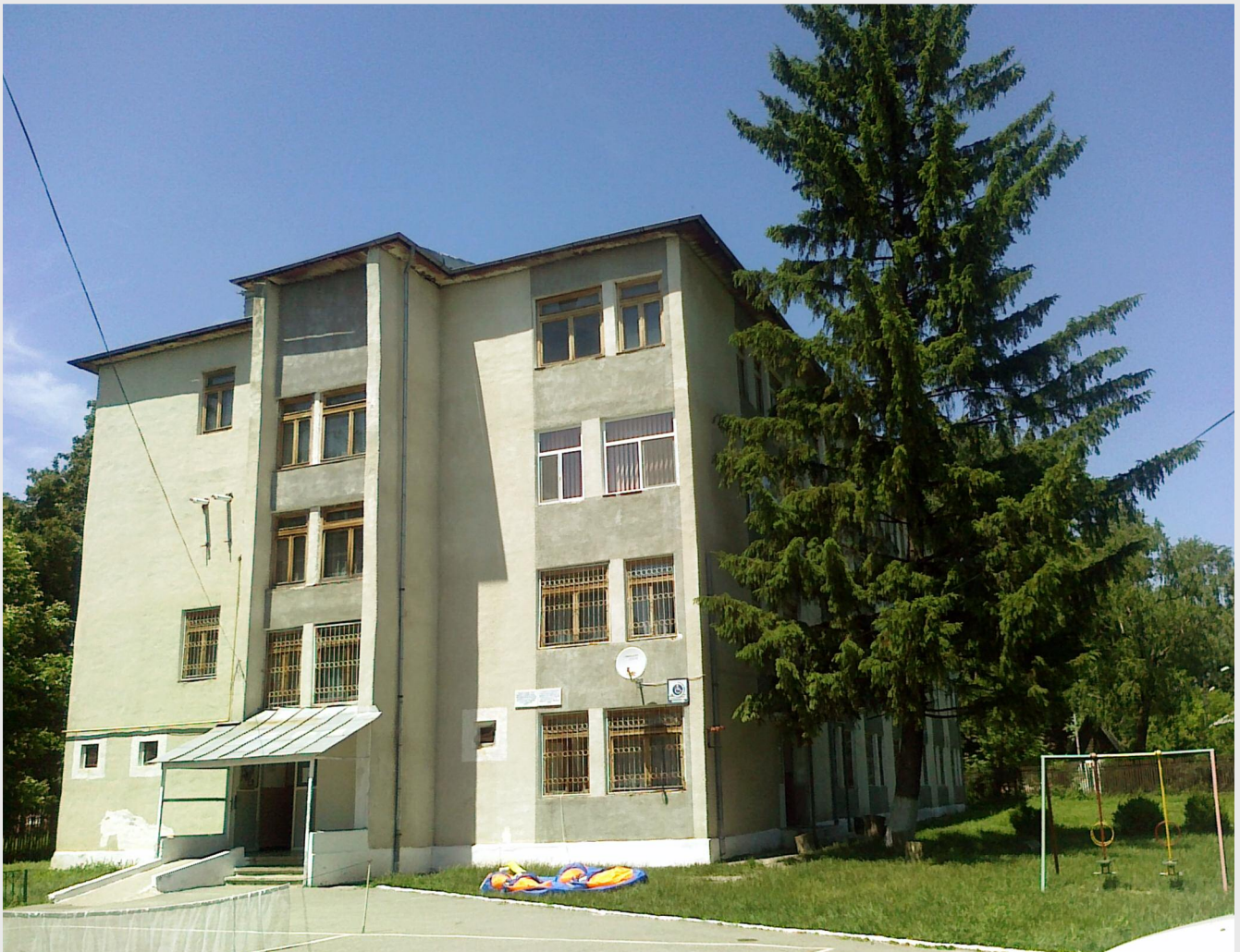
Centrul Social Găești