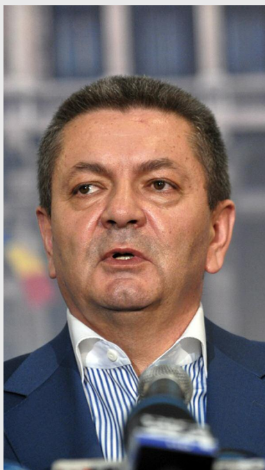
Ioan Rus, ministrul transporturilor

„Discuțiile vor continua. Noi vom continua să lucrăm în comisii și după ce ministrul Rus se întoarce de la Bruxelles cu acest document. Sunt foarte multe lucruri de discutat. Sunt chestii legate de detalii tehnice, dar pe care în perioada următoare în ambele comisii le vom lua din nou în discuție, pentru că astăzi am discu-