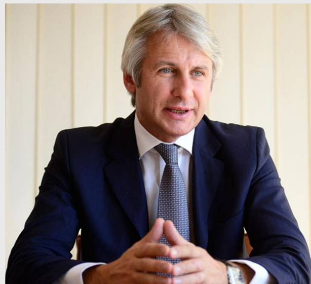
Eugen Teodorovici, ministrul fondurilor europene

Acesta a arătat că vede 2015 ca pe un an în care se vor schimba foarte multe din punctul de