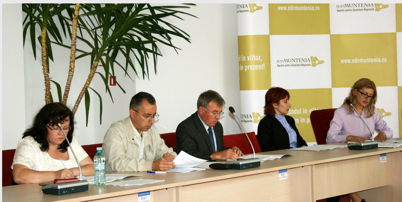
Cea de-a doua Reuniune a Comisiei Regionale pentru elaborarea criteriilor de selecție a proiectelor strategice ale regiunii Sud Muntenia pentru 2014 - 2020, 30 mai 2013, Călărași