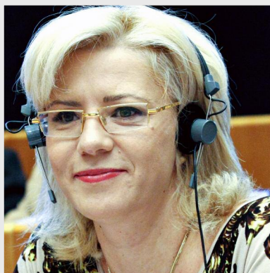
Corina Crețu, noul comisar pentru

Șase membri ai Comisiei Jose Manuel Barroso II se vor regăsi și în viitorul executiv UE - Kristalina Gheorghieva (Bulgaria), Neven