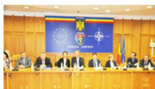
Au venit să vorbească despre posibilitatea terminării proiectului Molivișu

Lucrările au reînceput la pârta de schi din stațiunea Molivișu și este posibil ca la iarnă să putem merge pe prima pârta de acolo, anunțau ieri, la conferința de presă de la CJ Argeș, investitorii. La această conferință au participat atât membrii Asociației de Dezvoltare Intercomunitară Molivișu, cât și reprezentanți ai constructorului italian Bora Industrial și ai firmei austriece Doppelmayr, firma care va livra telecablul pentru viitoarea stațiune de la Molivișu, din comuna Arefu.