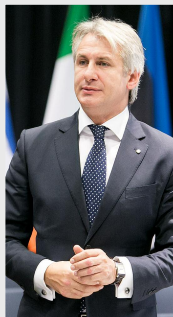
Eugen Teodorovici, ministrul fondurilor europene