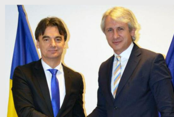
Eugen Teodorovici, ministrul fondurilor europene, alături de Branko Grčić, vicepremierul croat