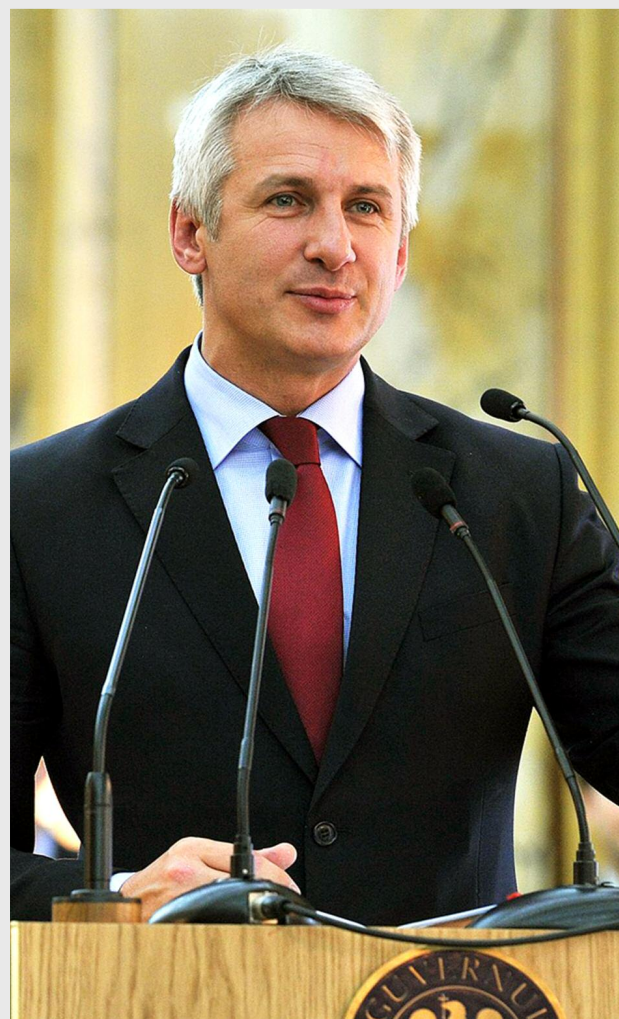
Eugen Teodorovici, ministrul fondurilor europene

De exemplu, proiectele ce urmăresc integrarea socială și dezvoltarea comunităților marginalizate din România, prin stimularea asocierii actorilor dintr-un teritoriu care elaborează și aplică strategii integrate, multisectoriale de dezvoltare locală, vor fi finanțate din Programul Operațional Capital Uman (POCU), Programul Operațional Regional (POR) și Programul Național de Dezvoltare Rurală (PNDR). Proiectele de acest tip implemen-