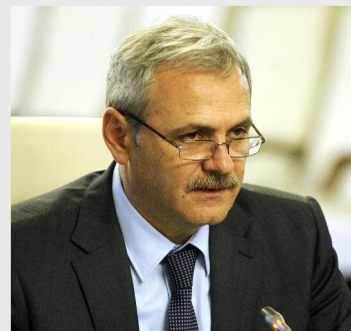
Liviu Dragnea, vicepremierul României