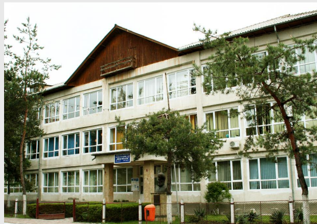
Școala nr. 1 „Mihai Viteazu”, Pucioasa, județul Dâmbovița

Prin implementarea proiectului, ce are ca termen de realizare 14 luni, se urmărește îmbunătățirea calității infrastructurii de educație pentru asigurarea unui proces de învățământ la standarde europene și, totodată, pentru creșterea participării populației școlare la procesul educațional. Cu sprijin financiar nerambursabil Regio se vor executa lucrări de modernizare a Școlii nr. 1 „Mihai