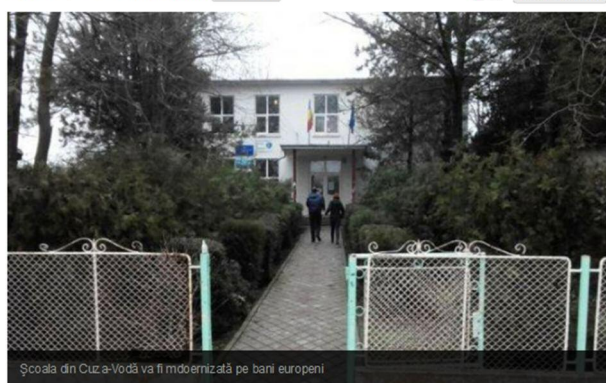
Școala din Cuza-Vodă și va fi modernizată pe bani europeni

Școala cu clasele I-VIII din comuna Cuza-Vodă este prima din județul Călărași care va fi reabilitată cu fonduri europene. Unitatea de învățământ va primi peste 5,8 milioane de lei pentru îmbunătățirea infrastructurii educaționale. Agenția pentru Dezvoltare Regională Sud Muntenia va semna pe 2 aprilie primul contract de finanțare în cadrul programului Regio pentru îmbunătățirea activității școlare.