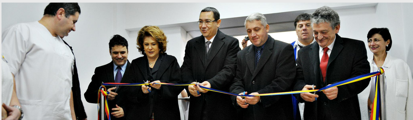
La inaugurare a fost prezent și Victor Ponta, prim-ministrul României