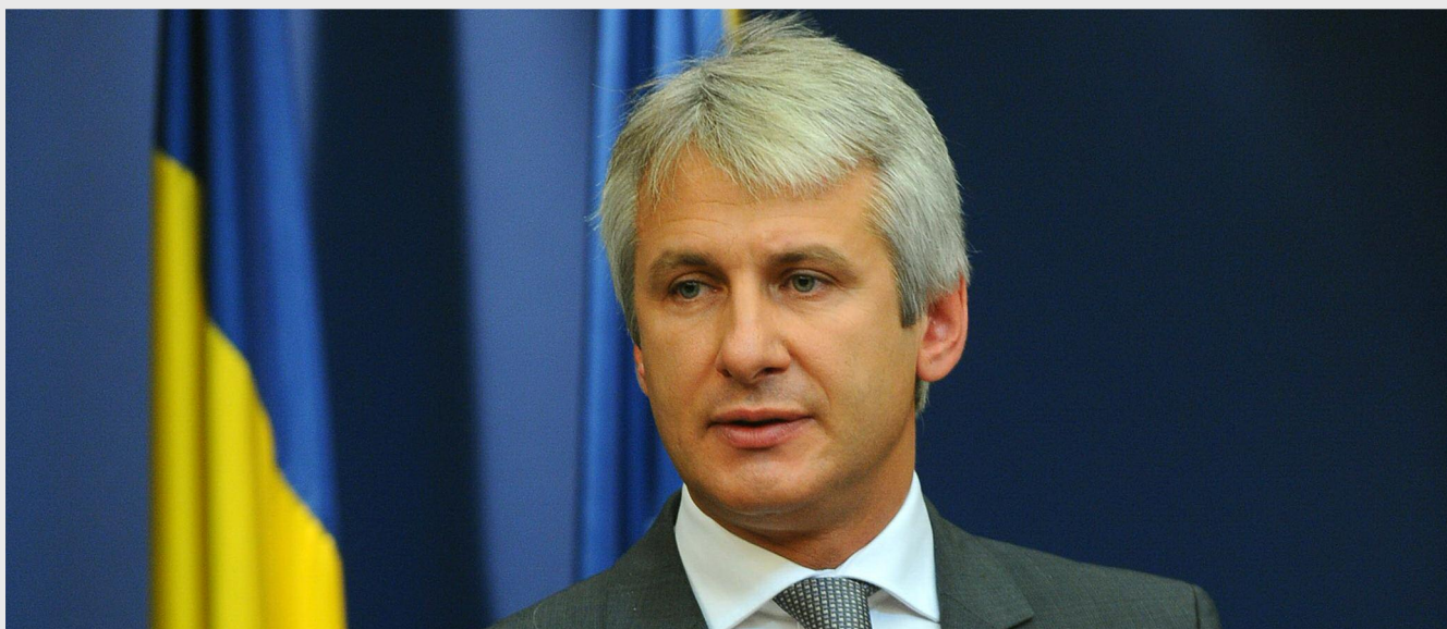
Eugen Teodorovici, ministrul fondurilor europene