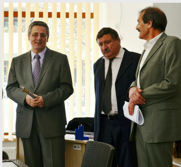
Centrul de Îngrijire și Asistență Slobozia - DGASPC Ialomița a obținut finanțare Regio pentru proiectul „Extindere, reabilitare termică și dotare centru îngrijire și asistență municipiul Slobozia, județul Ialomița”

Dintre acestea au primit finanțare 38 de proiecte, a căror valoare totală este de 216.065.022,63 lei, din care suma nerambursabilă solicitată este de 148.552.095,30 lei.