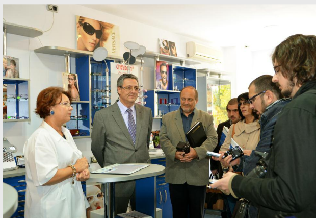
Clinica Oftalmologică Opti Stil Slobozia - SC ALPHA SRL a obținut finanțare Regio pentru proiectul „Dezvoltarea microîntreprinderii ALPHA GROUP SRL prin achiziția unor echipamente performante pentru activitatea oftalmologică”