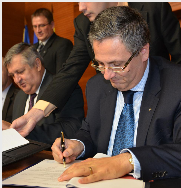
Contractul de finanțare este primul semnat în țară și la nivelul regiunii

În cadrul conferinței de presă organizată cu prilejul semnării contractului de finanțare, directorul