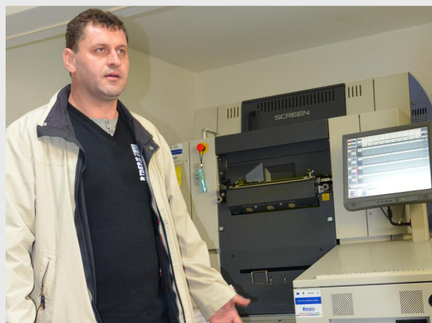
Tipografia ROTATIP - SC ROTATIP SRL a obținut finanțare Regio pentru proiectul „Achiziționare aparat tipărit True Press 344 RL”