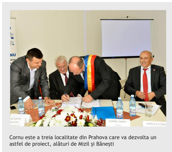
Cornu este a treia localitate din Prahova care va dezvolta un astfel de proiect, alături de Mizil și Bănești