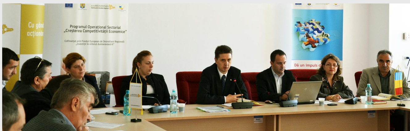
ADR Sud Muntenia a organizat primul seminar de instruire pentru beneficiarii de fonduri POS CCE