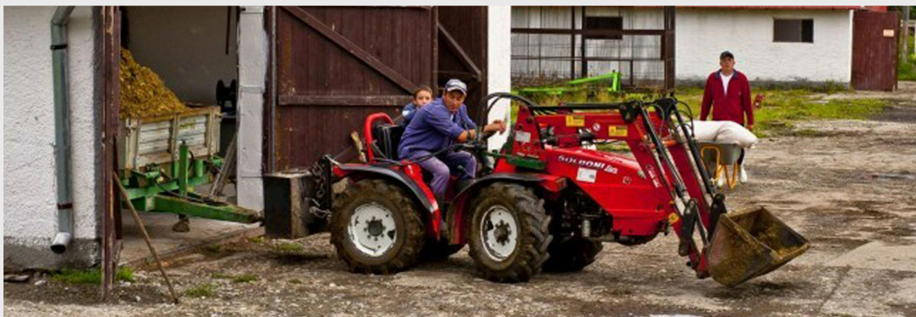
Cofinanțarea proiectelor depuse pe Măsura 121 - „Modernizarea exploatațiilor agricole” va putea fi asigurată prin accesarea microcreditelor