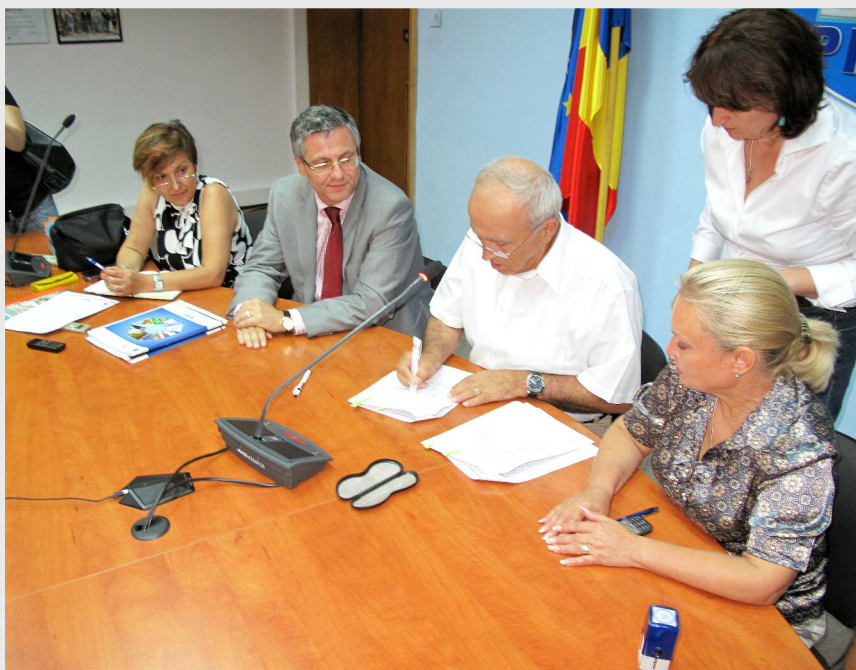
Proiectul, al cărui beneficiar este UAT Prahova, propune realizarea pasajului rutier în continuarea DJ 102 peste DN 1B