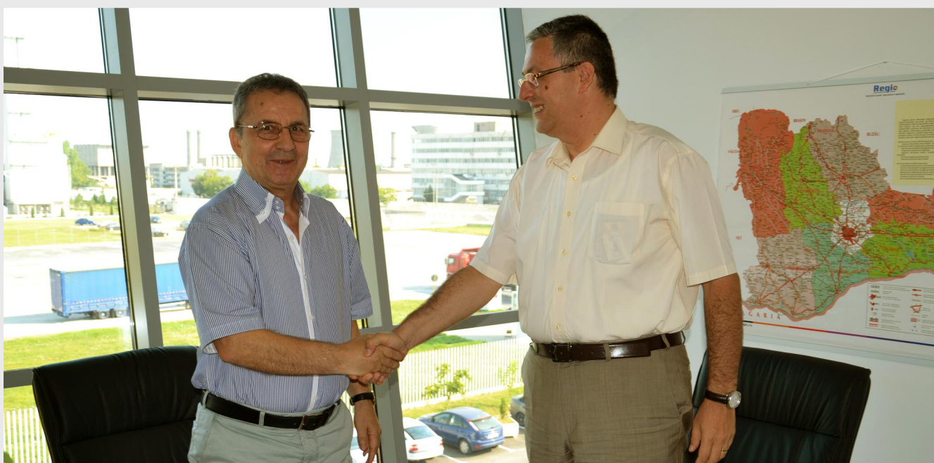
Contractul de finanțare a fost semnat la sediul ADR Sud Muntenia