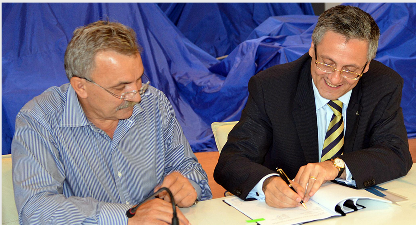
Contractul semnat asigură finanțarea pentru îmbunătățirea serviciilor de asistență medicală acordate locuitorilor din Curtea de Argeș și împrejurimi