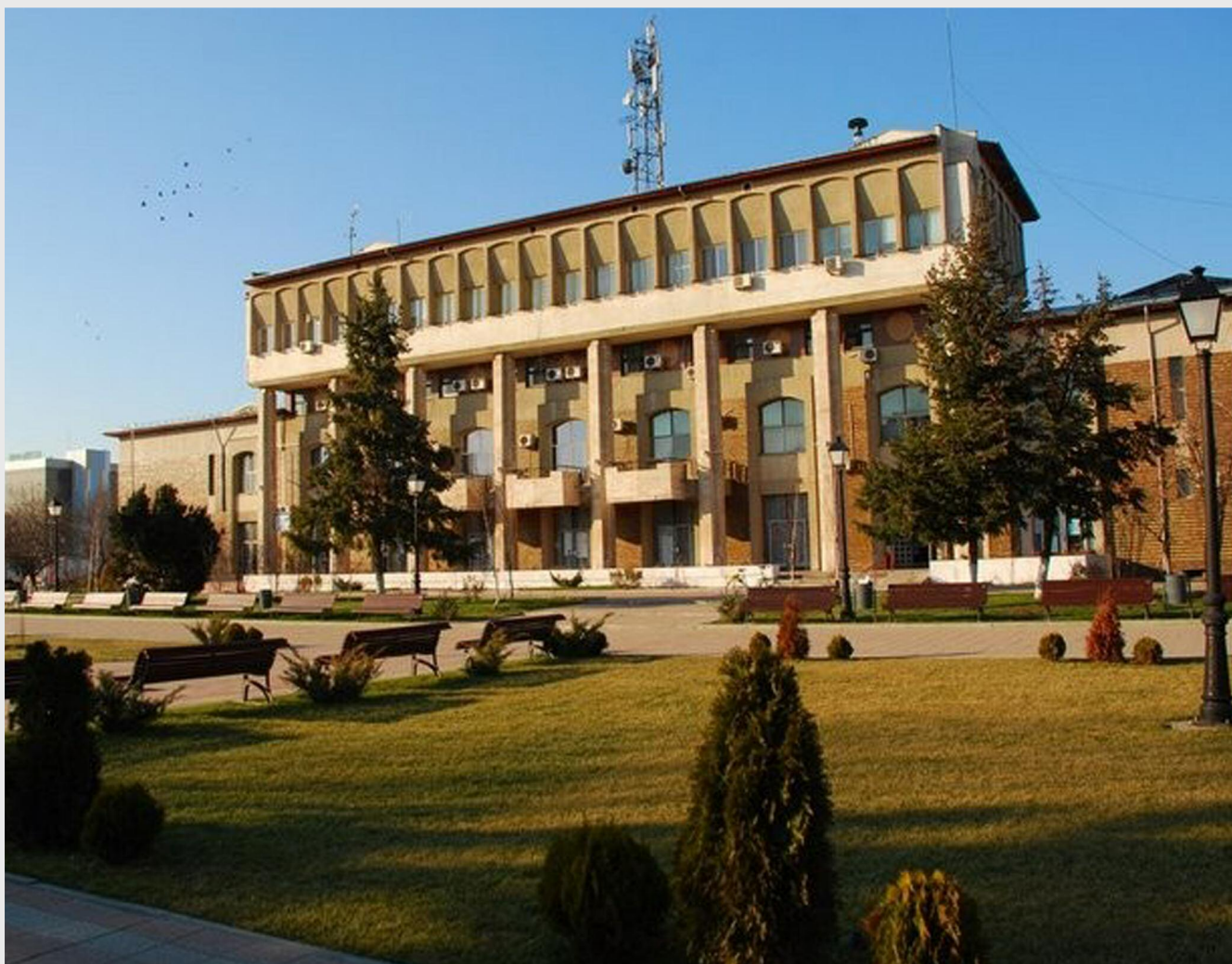
Primăria orașului Zimnicea