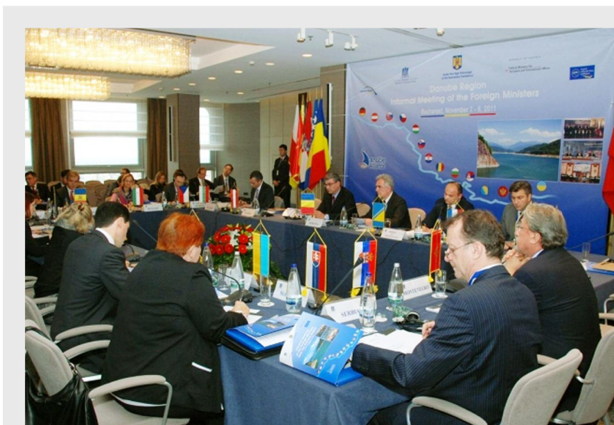
Strategia pentru regiunea Dunării a fost lansată în anul 2011, la doi ani de la solicitarea Uniunii Europene

„Strategia UE pentru regiunea Dunării își propune să impulsioneze creșterea și crearea de locuri de muncă în regiune printr-o mai bună elaborare a politicilor și o finanțare mai eficientă”, a afirmat, în deschiderea reuniunii, Maros Sefcovic. „Știința poate să aducă un ajutor real prin furnizarea de date bazate pe elemente