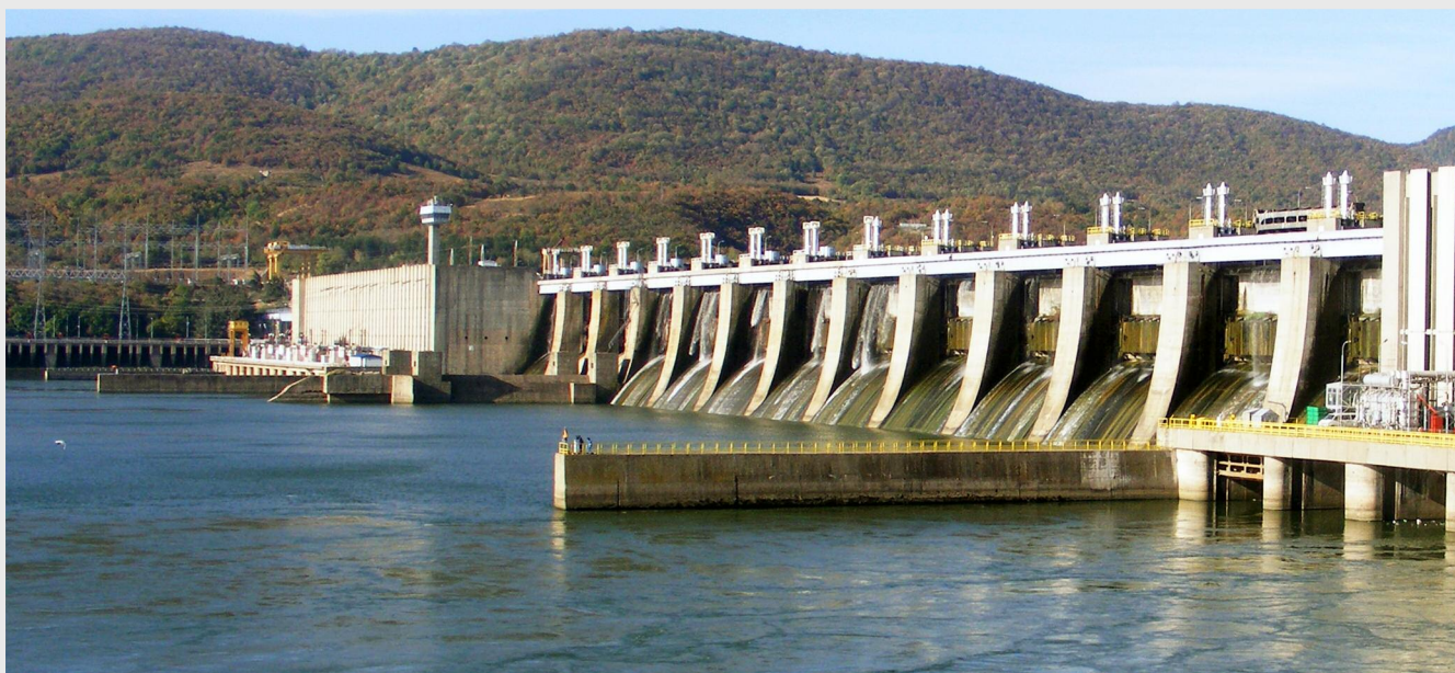
Realizarea proiectului privind hidrocentrala de la Seaca va duce la dezvoltarea economică a zonei municipiului Turnu Măgurele