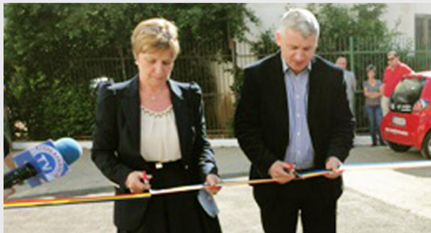
Inaugurarea Complexului de Servicii Sociale „Floare de Colț”, Târgoviște

Lucrările, în valoare de 183.756 de lei, au fost realizate în 23 de zile și au constat în refacerea finisajelor interioare și exterioare, degradate ca urmare a formării condensului pe anumite porțiuni, a precipitațiilor cât și a calității slabe a finisajelor existente, reabilitarea termică și lucrări noi.