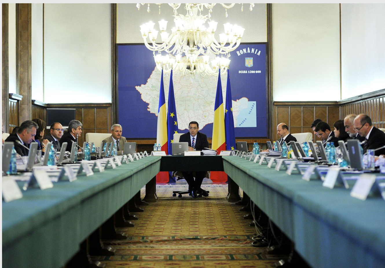
Schema de minimis aprobată de Guvern are un buget de 100 de milioane de euro