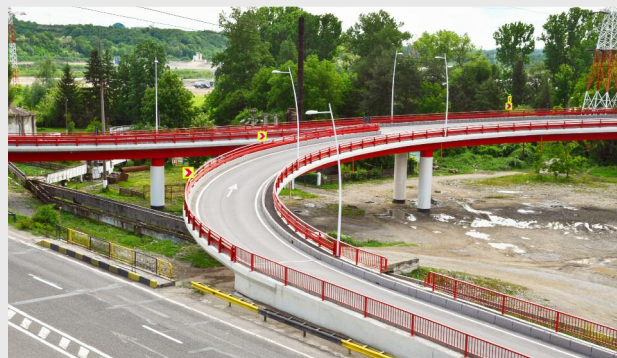
Calea Daciei de la intrarea în municipiul Câmpina a fost cel de-al doilea proiect vizitat împreună cu jurnaliștii

Proiectul „ Lucrări de modernizare, rețele utilități, facilități de acces și dotări la C.R.R.N.P.A.H.