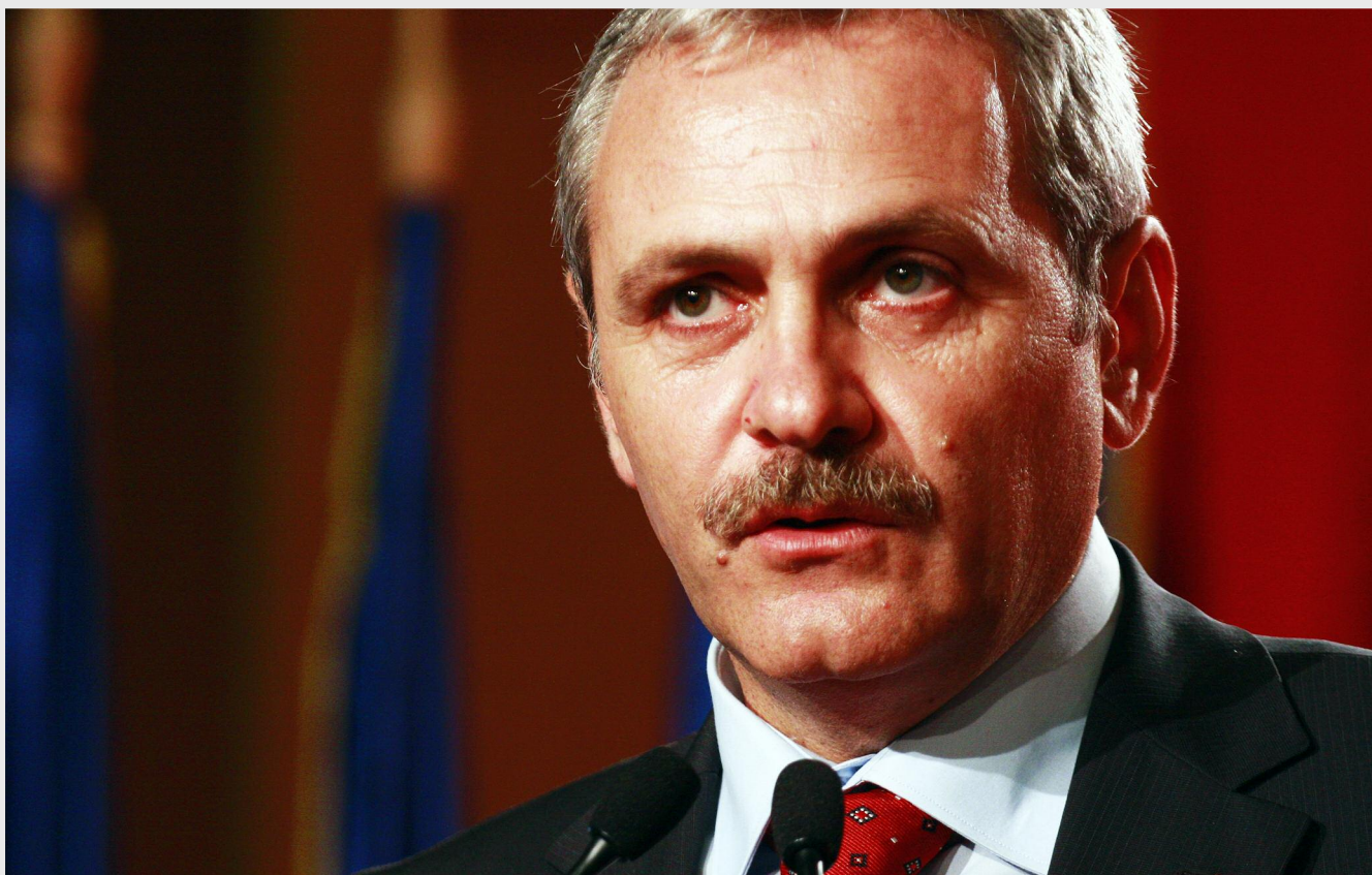
Liviu Dragnea, ministrul dezvoltării regionale și administrației publice este convins că regionalizarea va fi un proces de succes în România