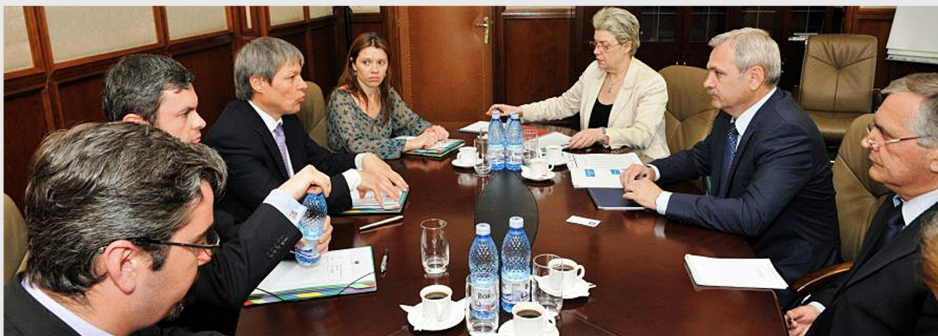
Liviu Dragnea, ministrul dezvoltării regionale și administrației publice, și Dacian Cioloș, comisarul european pentru agricultură, au convenit că prioritatea o reprezintă funcționarea camerelor agricole ca organisme care să sprijine agricultorii și fermierii români