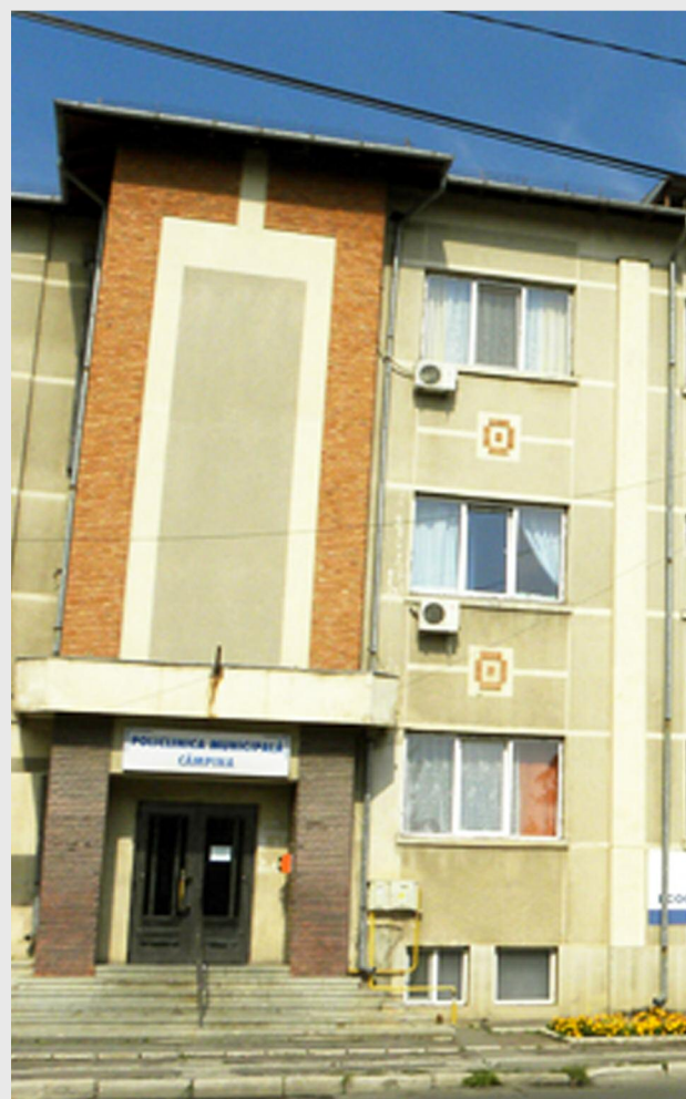
Policlinica din Câmpina