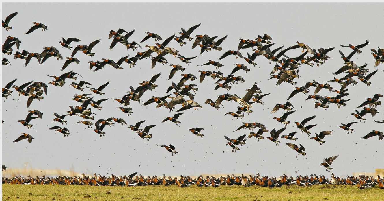
România a desemnat 19 zone umede de importanță internațională, cu o suprafață de 1,156 milioane de hectare