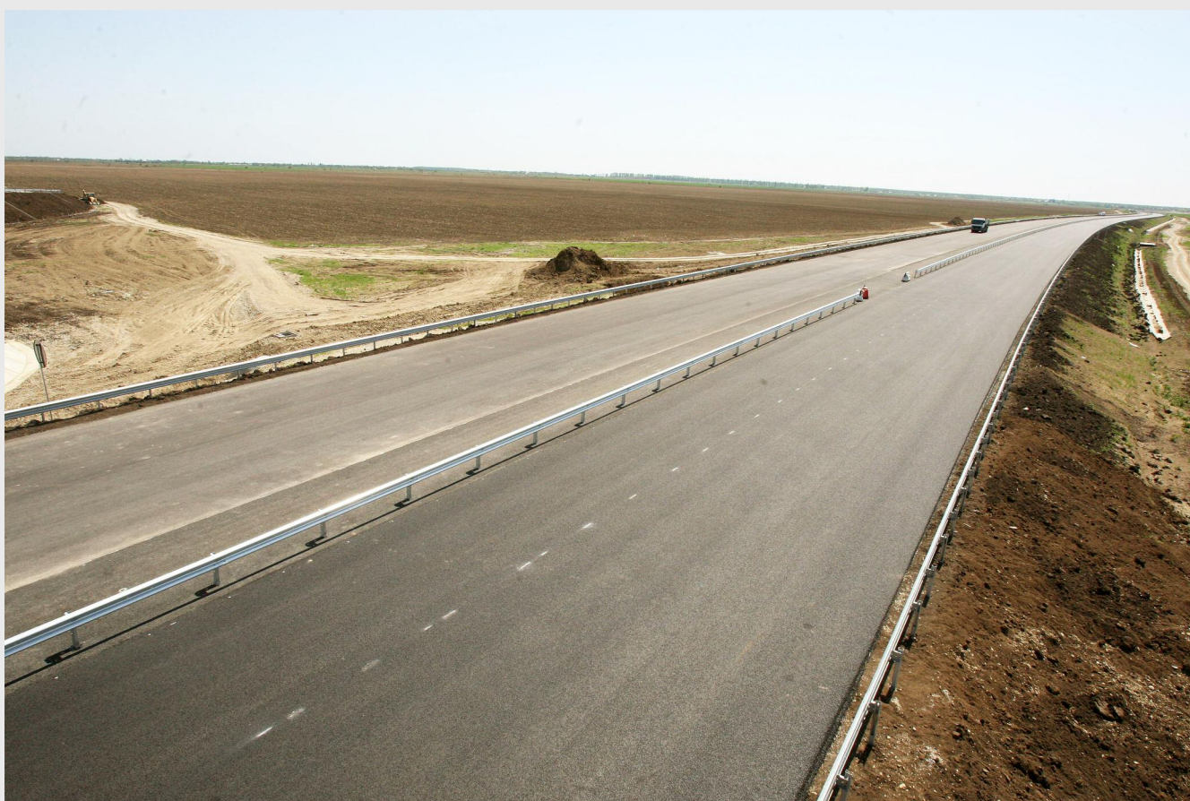
Centura ocolitoare a Alexandriei va deveni funcțională în acest an