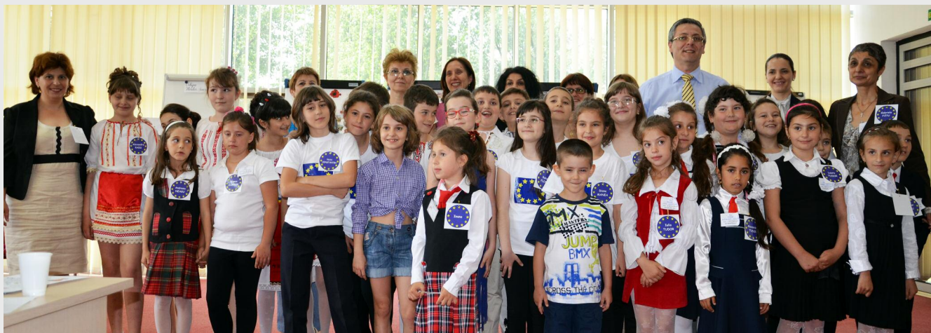
La evenimentul organizat la sediul ADR Sud Muntenia au participat elevi de la Liceul Teoretic „Mihai Eminescu” Călărași, Școala cu clasele I - VIII nr. 5 „Nicolae Titulescu” Călărași și Școala cu clasele I - VIII nr. 1 Modelu