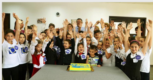
În încheierea evenimentului micuții au gustat din prăjiturile și tortul tematic oferite de Ziua Europei