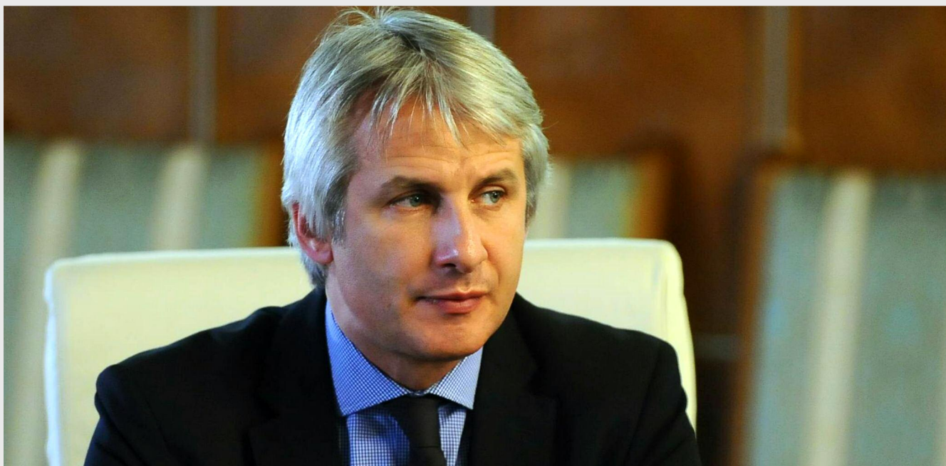
Eugen Teodorovici, ministrul fondurilor europene