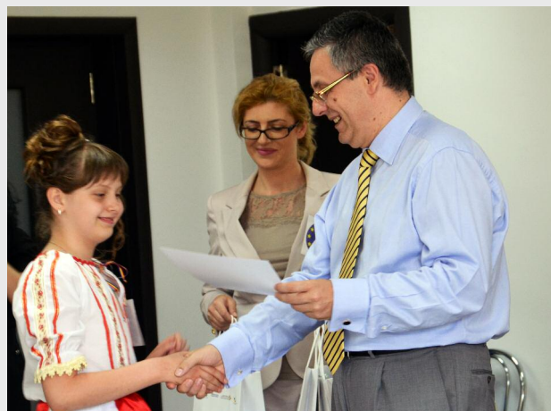
Copiii au fost premiați de Liviu Mușat, directorul ADR Sud Muntenia

Ziua de 9 Mai reprezintă o zi a bucuriei de a fi împreună și a voinței de solidaritate a mării comunități din care fac parte cetățenii Europei Unite, care s-a construit de-a lungul deceniilor ca o unitate în diversitate.