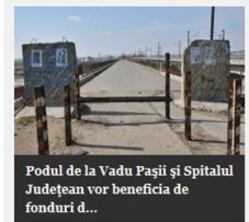
Podul de la Vadu Pașii și Spitalul Județean vor beneficia de fonduri d...