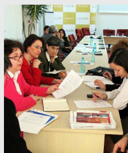
Călărași, 21 martie