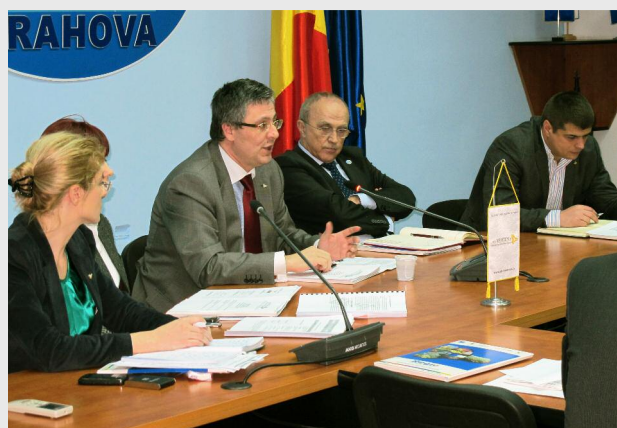
Ploiești, 25 martie