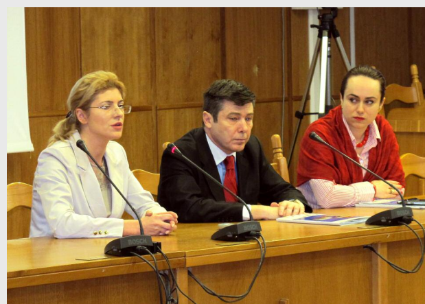
Pitești, 28 martie

Începând din luna martie 2013, Agenția pentru Dezvoltare Regională Sud Muntenia a lansat procesul de consultare publică asupra primului draft al analizei socio-economice și analizei SWOT, ambele părți componente ale Planului de Dezvoltare Regională 2014 - 2020. Documentele vor fi actualizate cu date statistice la zi, pe măsura publicării acestora. Totodată, fiind supuse consultării publice, vor fi îmbunătățite în baza contribuțiilor și propunerilor partenerilor regionali. Materialele pot fi consultate pe site-ul nostru, la secțiunea Planificare regională și parteneriate , link: http://www.adrmuntenia.ro/static/55/planificare-regionala-si-parteneriate.html .