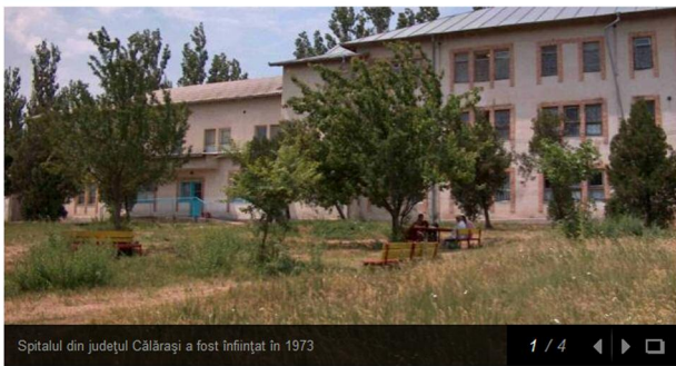
Spitalul din județul Călărași a fost înființat în 1973

Îmi place 8 persoane apreciază asta. Înscrie-te pentru a vedea ce le place prietenilor tăi.