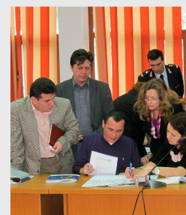
Alexandria, 22 martie