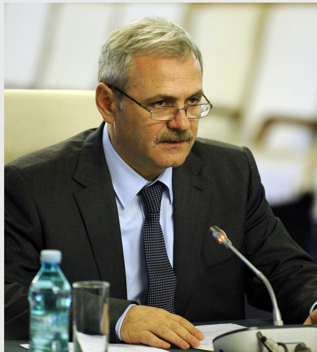
Viceprim-ministru Liviu Dragnea

Vicepremierul a explicat de asemenea de ce este important ca regionalizarea să fie măcar stabilă la 31 decembrie. Deoarece aceasta face parte din programarea pentru perioada 2014 - 2020 a Uniunii Europene de finanțare, ce prevede în primul rând redistribuirea fondurilor de dezvoltare pentru țările membre. Or, modul în care va fi tratată România din această perspectivă depinde în