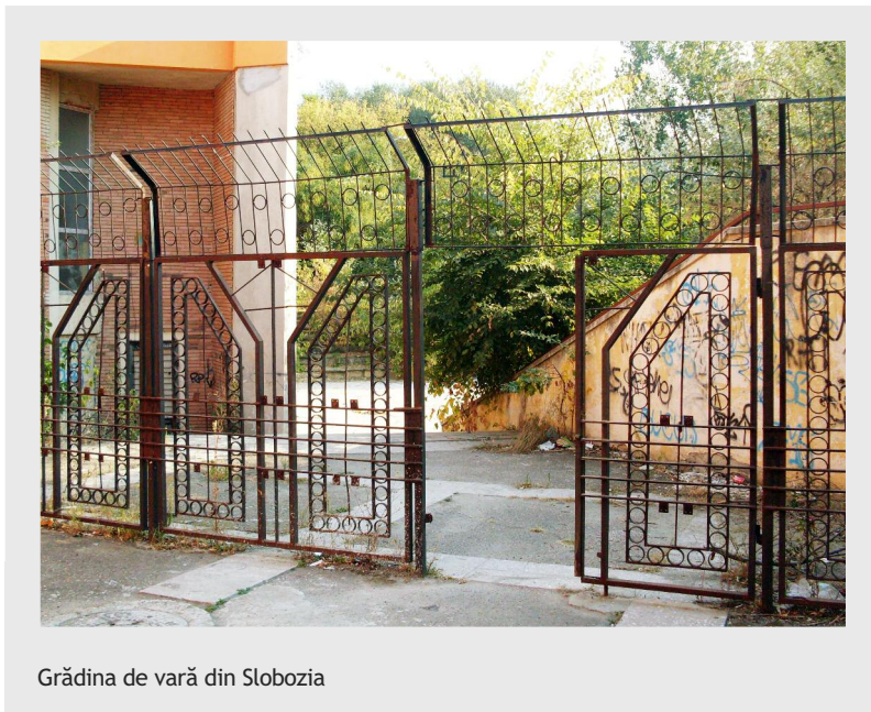
Grădina de vară din Slobozia