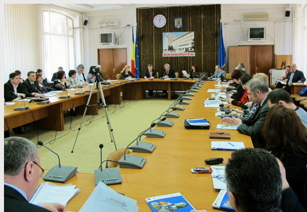
Târgoviște, 20 martie

În scopul fundamentării priorităților de finanțare ale Planului de Dezvoltare Regională Sud Muntenia 2014 - 2020, în cadrul celor șapte întâlniri de lucru s-a dezbătut analiza socio-economică a regiunii Sud Muntenia și s-au făcut propuneri de măsuri indicative de finanțare. De asemenea a fost prezentat un model de fișă de proiect, pe baza căruia vor fi colectate idei de proiecte strategice, integrate, cu impact major, pentru care există un acord partenerial al unității administrativ-teritoriale.