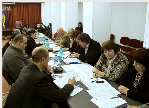
Slobozia, 9 aprilie