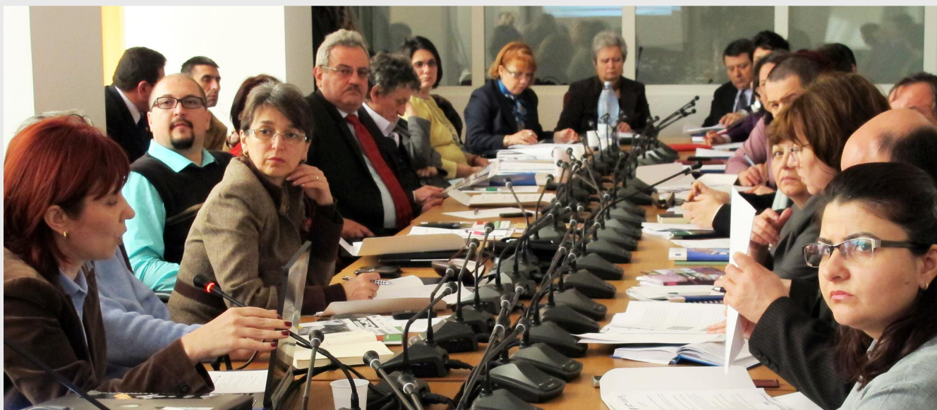
Giurgiu, 27 martie

le/ unităților administrativ-teritoriale implicate în realizarea și implementarea acestuia, indiferent de sursa de finanțare. Fișa face parte din instrumentele de colectare de informații și consultare publică utilizate în procesul de elaborare a Planului de Dezvoltare Regională 2014 - 2020.