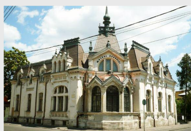
Muzeul Ceasului „Nicolae Simache”

Autoritățile publice au anunțat, joi, că termenul de realizare a investiției s-a scurtat. „ Imediat după semnarea contractului, conform graficului de implementare, am demarat procedura de achiziționare a lucrărilor de servicii și a lucrărilor de construcții. Din păcate, în toamna anului 2012, din cauza unor contestații ridicate de ofertanți, dar și a