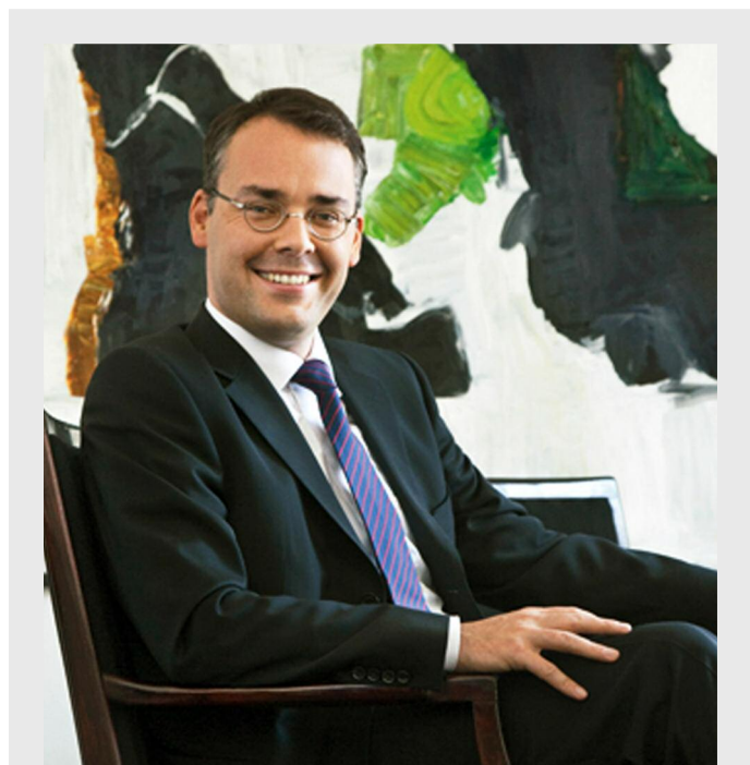
Peter Friedrich, ministrul pentru Bundesrat, Afaceri Europene și Internaționale al landului Baden-Württemberg a fost oaspetele lui Nicolae Barbu, primarul municipiului Giurgiu