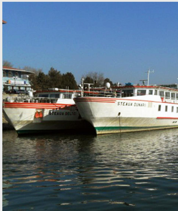
Județul Ialomița ar putea beneficia de o nouă infrastructură de transport naval pe Dunăre în zona Fetești - Giurgeni