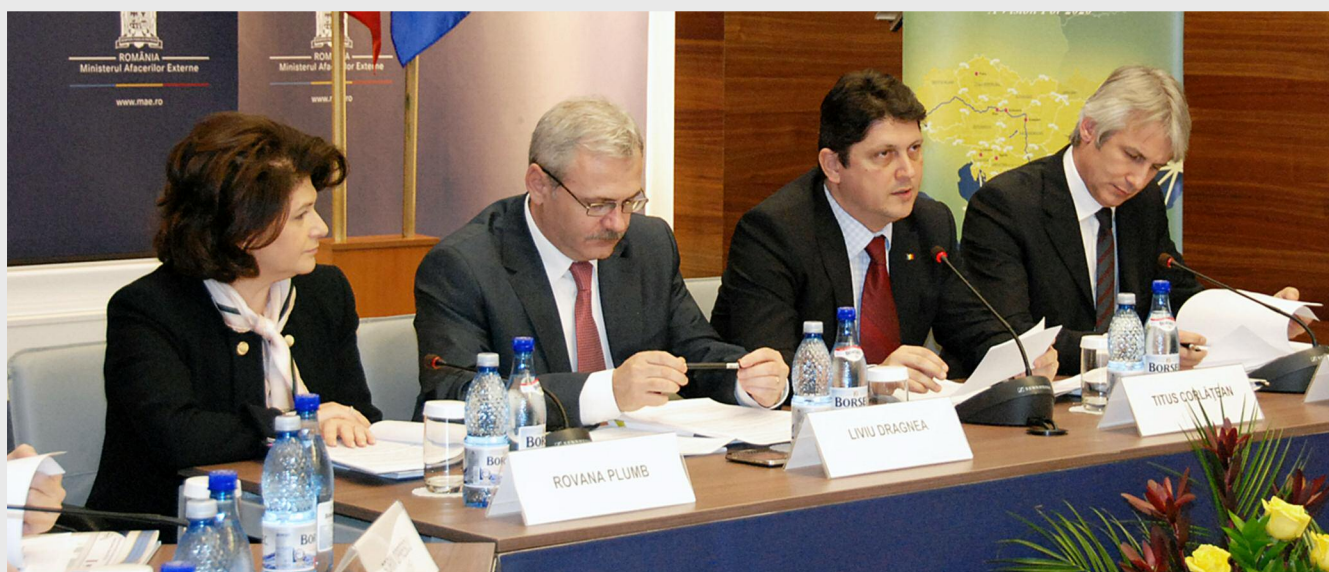
La reuniunea la nivel ministerial a Forumului Național al Strategiei UE pentru Regiunea Dunării au participat domnul viceprim-ministru Liviu Nicolae Dragnea, ministrul mediului și schimbărilor climatice, doamna Rovana Plumb, ministrul fondurilor europene, domnul Eugen Orlando Teodorovici, ministrul delegat pentru întreprinderi mici și mijlocii, mediu de afaceri și turism, doamna Maria Grapini

toate statele riverane și serviciile relevante ale Comisiei Europene.