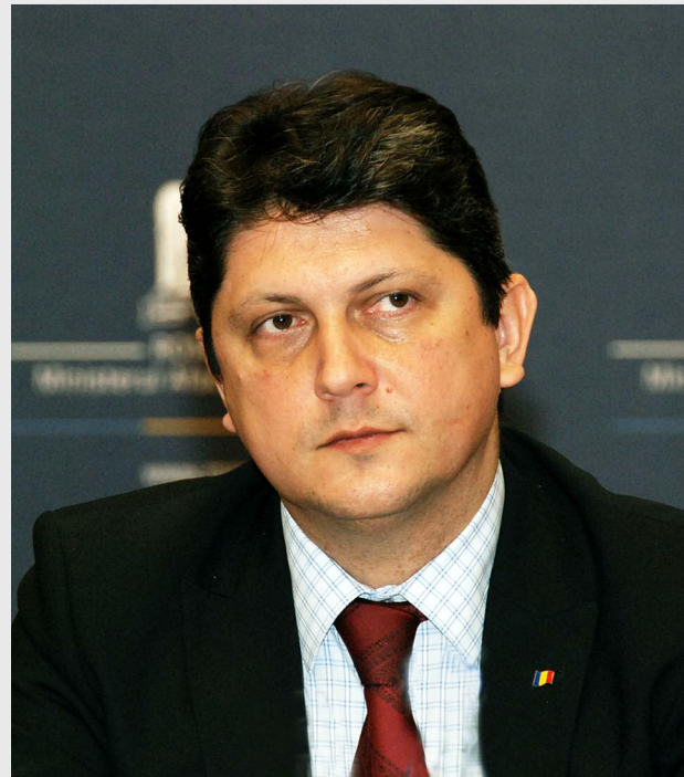
Domnul Titus Corlățean, ministrul afacerilor externe a condus reuniunea la nivel ministerial a Forumului Național al Strategiei UE pentru Regiunea Dunării

Ministrul Titus Corlățean a atras atenția asupra importanței Strategiei, un proiect de interes național și o inițiativă politică importantă a României la nivelul UE. Astfel, în intervenția sa, șeful diplomației române a arătat că factorul esențial pentru succesul Strategiei Dunării este generarea de proiecte integrate și fezabile, de către actorii din mediul public și privat românesc, împreună cu parteneri din statele riverane. În acest sens, ministrul afacerilor externe a menționat câteva din proiectele derulate, coordonate de România sau cu o consistentă participare românească, referitoare la îmbunătățirea condițiilor de navigație și modernizarea infrastructurii portuare, manage-