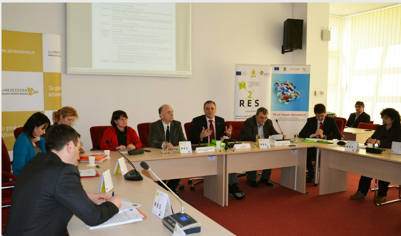
Workshop-ul găzduit de ADR Sud Muntenia s-a bucurat de participarea largă a reprezentanților autorităților locale - primării și consilii județene din regiunea Sud Muntenia