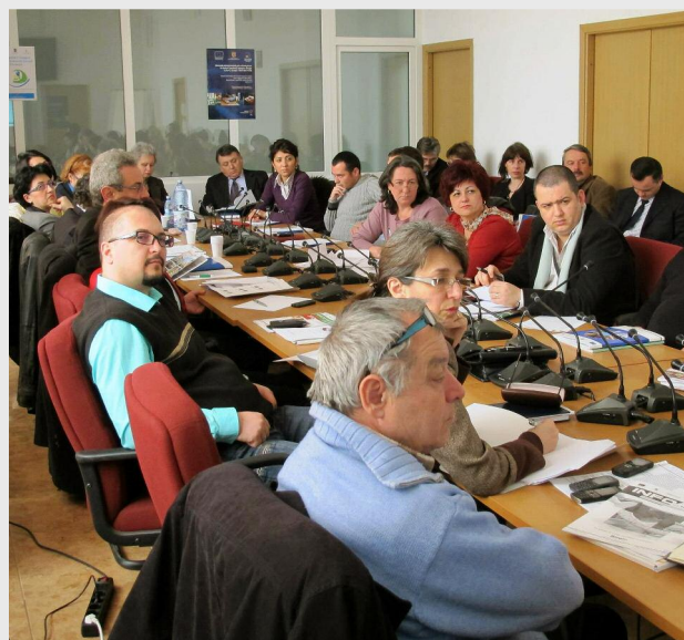
Grupul Tematic Regional „Susținerea sănătății și a protecției sociale”

În scopul fundamentării priorităților de finanțare ale Planului de Dezvoltare Regională Sud Muntenia 2014 - 2020, în cadrul acestui workshop s-au discutat subiecte legate de stadiul elaborării analizei socio-economice, revizuirea analizei SWOT, propuneri de priorități și măsuri de finanțare aferente domeniului „Susținerea sănătății și a protecției sociale”.