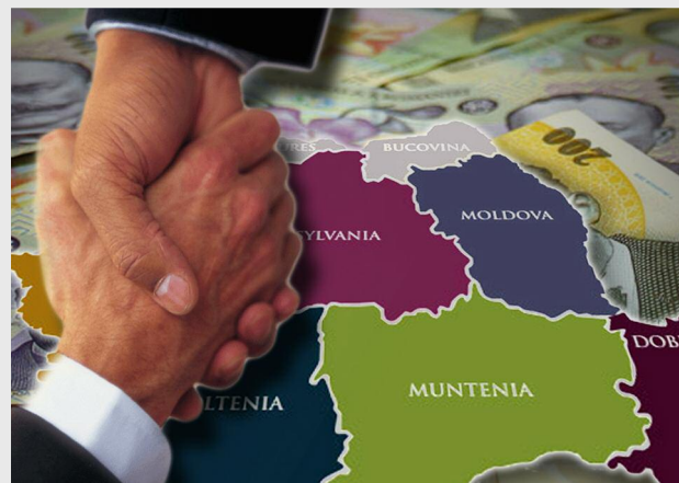
Prima dezbateră publică pe tema regionalizării a fost organizată de Ministerul Dezvoltării Regionale și Administrației Publice, împreună cu Academia Română

În mod particular, regionalizarea va conduce la creșterea capacității instituționale de a implementa proiecte finanțate din fonduri europene, capacitate afectată în prezent de birocrație și centralizarea excesivă a atribuțiilor guvernului central. De altfel, acesta este și motivul pentru care regionalizarea este încurajată de instituțiile europene, cu toate că nu este o condiție obligatorie. „Nu ne este cerută regionalizarea de către Comisia Europeană sau Uniunea Europeană, dar este o idee salută de partenerii noștri europeni dintr-un motiv simplu: capacitatea noastră instituțională de a absorbi fonduri europene. Cât timp vom ține totul la București la niște autorități de management