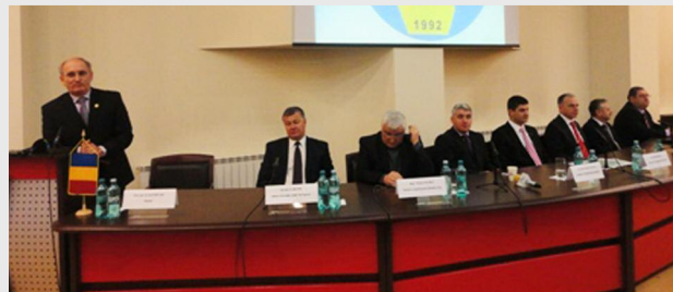
Evenimentul s-a desfășurat la Centrul Internațional de Conferințe al Universității „Valahia”

În cadrul evenimentului „Oportunități de afaceri în județul Dâmbovița”, desfășurat la Centrul Internațional de Conferințe al Universității „Valahia”, au fost prezentate proiecte aflate în derulare în județ, posibile proiecte de viitor în zone nevalorificate până acum, unde există potențial și resurse pentru dezvoltarea Târgoviștei.