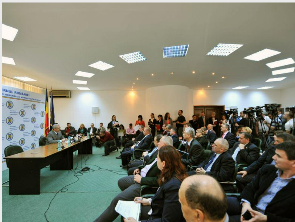
Domnul viceprim-ministru Liviu Dragnea a semnat 32 de contracte de finanțare, în data de 1 aprilie