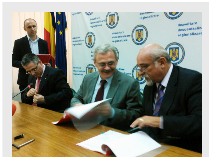
Semnarea contractului de finanțare a proiectului „Reabilitarea, modernizarea și echiparea ambulatoriului Spitalului de Psihiatrie Săpunari, județul Călărași”

Prin această investiție se urmărește dezvoltarea și modernizarea infrastructurii județene de servicii de sănătate mintală, prin reabilitarea, modernizarea și echiparea ambulatoriului de specialitate al Spitalului de Psihiatrie Săpunari, în vederea îmbunătățirii stării de sănătate a populației din județul Călărași. În urma implementării acestui proiect, ce se va realiza în 18 luni, va crește numărul de consultații, pacienții nemaifiind astfel redi-