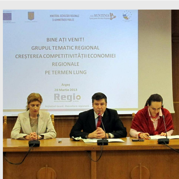
Sala de ședințe a Consiliului Județean Argeș a găzduit întâlnirea Grupului Tematic Regional „Creșterea competitivității economiei regionale”

Începând cu luna martie 2013, Agenția pentru Dezvoltare Regională Sud Muntenia a lansat procesul de consultare publică asupra primului draft al analizei socio-economice și analizei SWOT, părți componente ale Planului de Dezvoltare Regională 2014 - 2020. Ambele documente sunt variante de lucru, ce vor fi actualizate cu date statistice la zi, pe măsura publicării acestora. Totodată, fiind supuse consultării publice, ele vor fi îmbunătățite în baza contribuțiilor și propunerilor partenerilor regionali. Vă invităm să consultați documentele publicate pe site-ul nostru, la secțiunea Planificare