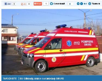
TARGOVISTE | ISU Dâmbovița, dotat cu 4 noi ambulanțe SMURD

14 noiembrie 2012, 07:59 | Autor: kati10ma | 161 afișări