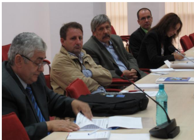
21 septembrie, ADR Sud Muntenia Călărași

La aceste întâlniri au participat aproximativ 60 de reprezentanți ai administrației publice și ai mediului privat, beneficiari de fonduri Regio, care au în derulare proiecte în Ialomița și Călărași. Obiectivul organizării acestor evenimente a fost de a sprijini beneficiarii în implementarea proiectelor Regio, dar și de a-i informa despre oportunitățile de finanțare oferite prin Fondul Național de Garantare a Întreprinderilor Mici și Mijlocii și despre stadiul pregătirii următoarei perioade de programare, 2014 - 2020. Totodată, au fost oferite informații utile despre posibilitățile de modificare a contractelor, prin notificare sau act adițional, precum și despre rolul ofițerului de monitorizare, cel care asigură legătura permanentă a beneficiarului cu Organismul Intermediar, acordă consultanță pe parcursul implementării și care monitorizează activitatea proiectului finanțat prin Regio. Un alt subiect important pe agenda întâlnirilor cu beneficiarii a fost dat de noile oportunități de finanțare din cadrul Axei prioritare 1 „Sprijinirea dezvoltării durabile a orașelor” - Domeniul Major de Intervenție 1.2 „Sprijinirea investițiilor în eficiența energetică a blocurilor de locuințe”.