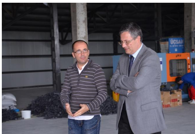
SC Thugs SRL: „Linie tehnologică de fabricație piese din material plastic prin injecție”