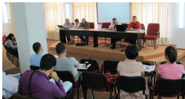
20 septembrie, Centrul Cultural „Ionel Perlea” Slobozia