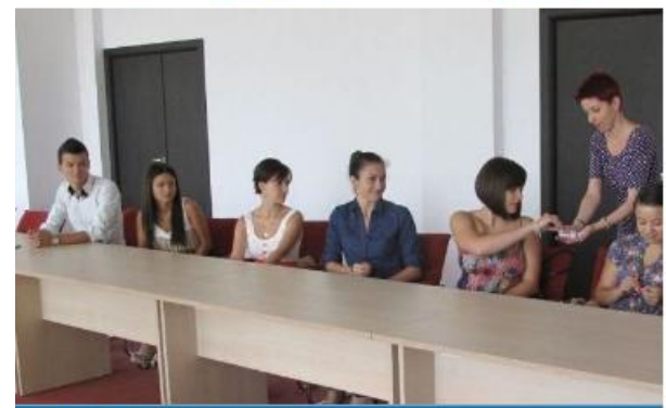
CĂLĂRAȘI | Viitorii specialiști la întâlnirea de la ADR

Agenția pentru Dezvoltare Regională(ADR) Sud Muntenia atrage tineri specialiști. Mai mulți studenți au participat la concursul de angajări pe perioada vacanței de vară. 13 tineri care urmează cursurile unei instituții de învățământ superior – studii la zi, în ani terminali, au răspuns „prezent” inițiativei.