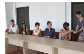
Citește articolul integral pe: Adevărul