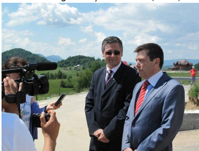
Inaugurarea DJ 730 (jud. Argeș), reabilitat prin Regio

2.382 de contracte de finanțare, în valoare totală de aproximativ 4,558 de miliarde de euro, au fost semnate până în data de 9 decembrie a.c., prin Regio - Programul Operațional Regional (POR), derulat de Ministerul Dezvoltării Regionale și Turismului (MDRT).