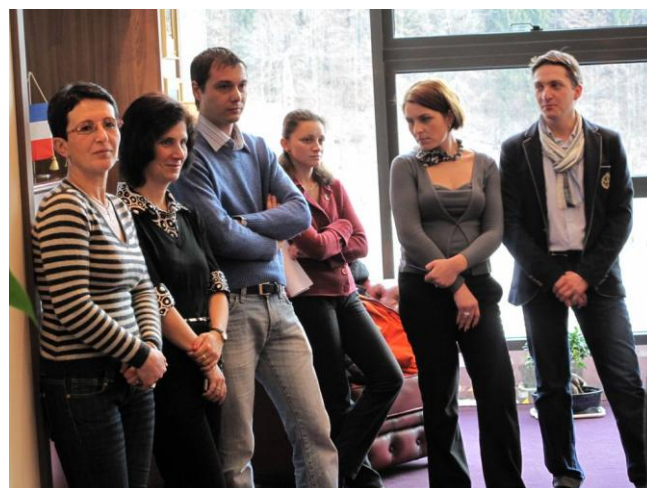
Echipele din cadrul primăriei, care au scris cele două proiecte

Contractul de finanțare al proiectului „Reabilitarea infrastructurii publice urbane oraș Sinaia <<Via Sinaia Design - Verde - Deschis>>” are o valoare totală de 81.856.120 de lei, din care: valoarea eligibilă nerambursabilă din FEDR este de 52.354.760,04 lei, valoarea eligibilă nerambursabilă din bugetul național este de 11.500.454,45 lei, iar cofinanțarea eligibilă a beneficiarului este de 1.303.167,64 lei.