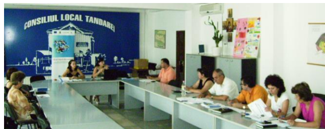
Seminar de informare - Țândărei, 23 iulie 2010

Agenția pentru Dezvoltare Regională Sud Muntenia continuă caravana de informare în toate județele regiunii cu scopul de a promova Programul Operațional Regional (Regio), Axa 4 „Sprijinirea dezvoltării mediului de afaceri regional și local” (Domeniile majore de intervenție 4.1 „Dezvoltarea durabilă a structurilor de sprijinire a afacerilor de importanță regională și locală” și 4.3 „Sprijinirea dezvoltării microîntreprinderilor”).