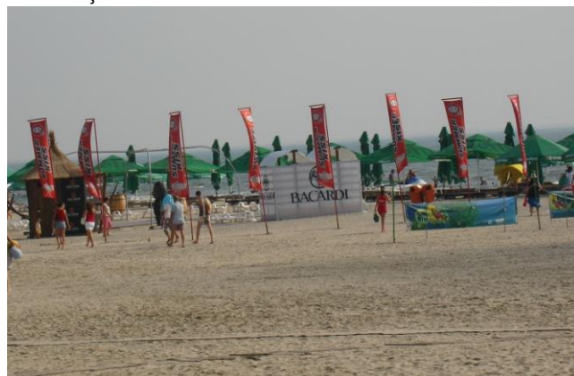
Litoralul românesc - Stațiunea Mamaia

- Elaborarea unei etichete pe baza indicatorilor de management durabili pentru a promova destinațiile turistice ce respectă criteriile de mediu, sociale și economice.