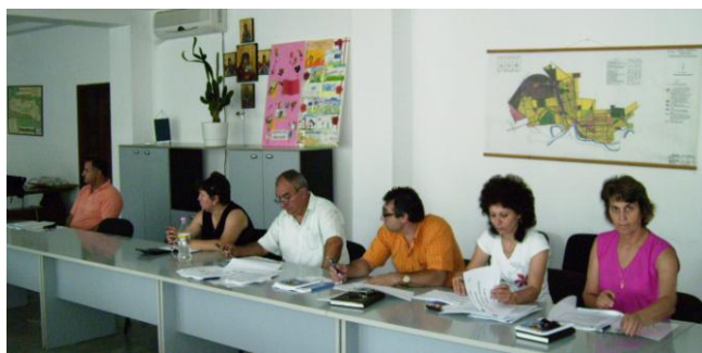
Seminar de informare - Tândărei, 23 iulie 2010

Autoritatea de Management pentru Programul Operațional Regional a publicat Ghidul solicitantului consolidat pentru Domeniul major de intervenție (D.M.I.) 4.3 „Sprijinirea dezvoltării microîntreprinderilor”. Documentul conține toate modificările legislative ce au intervenit în ultimele săptămâni, inclusiv prevederile ce se referă la eliminarea cofinanțării din partea beneficiarului. Acesta poate fi descărcat de pe minisite-ul Agenției pentru Dezvoltare Regională Sud Muntenia dedicat în exclusivitate Programului Operațional Regional 2007 - 2013 - http://regio.adrmuntenia.ro , link: http://regio.adrmuntenia.ro/domeniul-major-de-interventie-4-3-sprijinirea-dezvoltarii-micro-ntreprinderilor-p59.html .