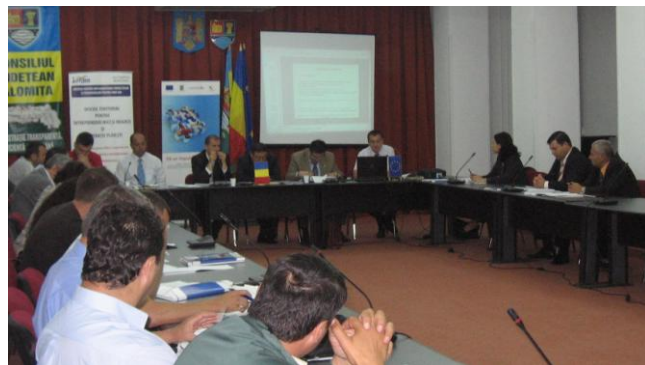
Sala de ședințe a Centrului Cultural „Ionel Perlea” Slobozia, 23 iunie 2010

Ialomița, ai presei locale, precum și reprezentanți de societăți comerciale din județ.