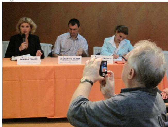
Prezentarea activității Rețelei de Informare REGIO Sud Muntenia

Pe parcursul acestei sesiuni au fost prezentate totodată activitățile rețelelor regionale privind promovarea Programului Operațional Regional și exemple de bune practici din activitatea comunicatorilor regionali.