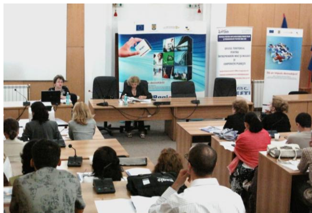
Sala mare de ședințe a Consiliului Județean Călărași, 22 iunie 2010

În data de 22 iunie 2010, Agenția pentru Dezvoltare Regională Sud Muntenia a organizat la Călărași, în sala mare de ședințe a Consiliului județean, un seminar de informare și instruire pentru potențialii beneficiari de fonduri nerambursabile Regio pentru mediul de afaceri din județ.