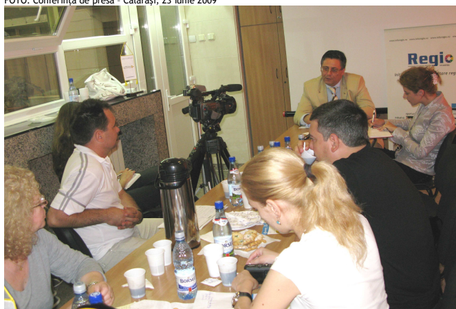
FOTO: Conferință de presă - Călărași, 23 iunie 2009

De asemenea, jurnaliștii au fost invitați la sediul Agenției pentru a lua pulsul activităților pe care le derulează experții ADR. Ceea ce a atras atenția în mod deosebit jurnaliștilor a fost spațiul mult prea mic pentru desfășurarea activităților cotidiene ale personalului Agenției.