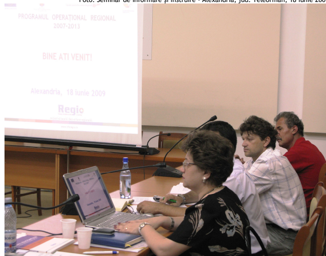
Foto: Seminar de informare și instruire - Alexandria, jud. Teleorman, 18 iunie 2009

În cadrul seminarilor au fost oferite informații despre principalele aspecte relevate în Ghidurile solicitantului pentru cele trei domenii majore de intervenție ale Axei prioritare 3 (solicitanți eligibili, aspecte legate de eligibilitatea proiectelor și a