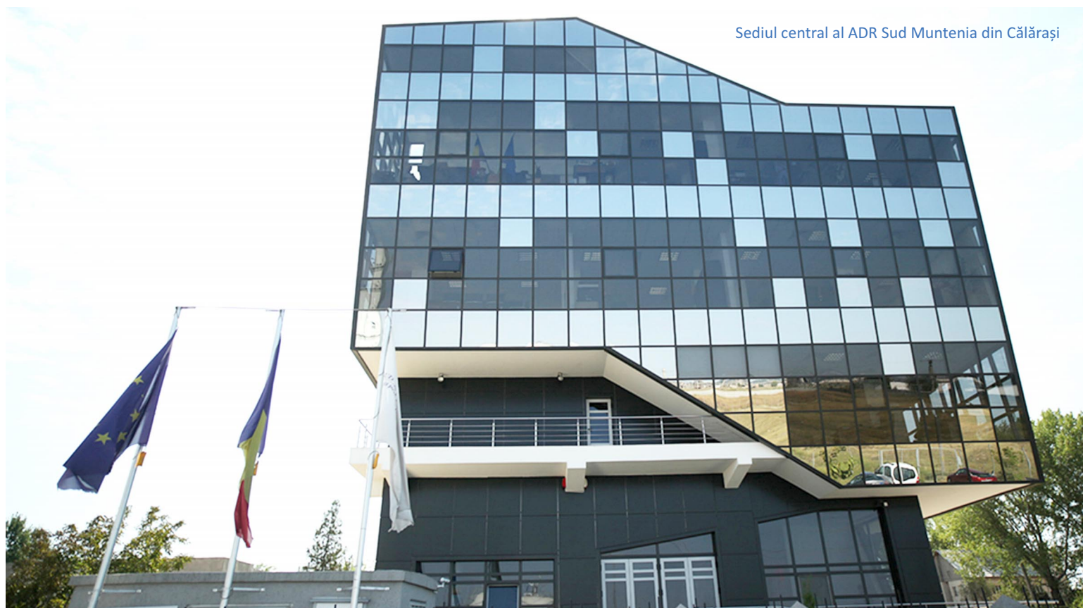
Sediul central al ADR Sud Muntenia din Călărași