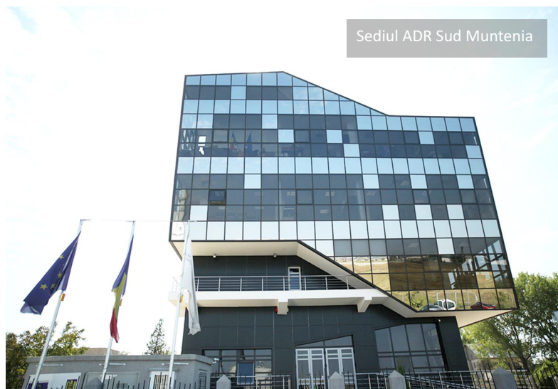
Sediul ADR Sud Muntenia

Prima versiune a Programului Operațional Regional pentru regiunea Sud Muntenia 2021-2027 poate fi consultată accesând link-ul următor: https://www.adrmuntenia.ro/draft-por-20212027/static/1332 .